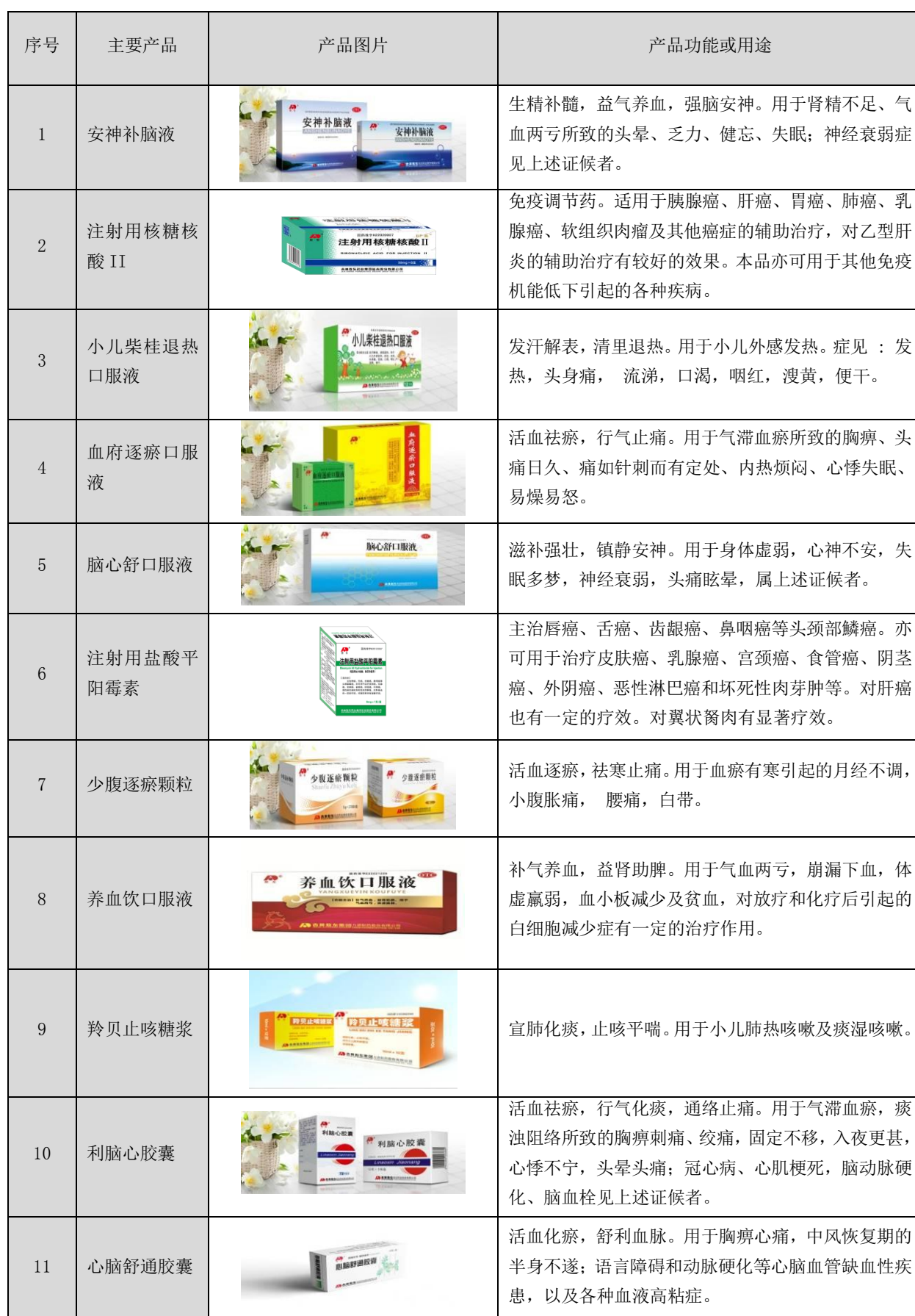
表 2：公司主要产品目录