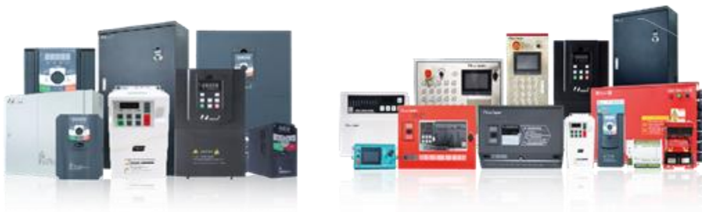
图2 低压变频器系列

2021年，公司低压变频器产品全年实现销售收入25,761.39万元，同比增长22.40%。2022年公司将持续加大研发投入，引进高端研发人员，完善研发测试设备，借力集团研发资源，提升产品竞争力。营销端，公司将继续拓展通用低压变频器市场，充分挖掘现有市场潜力，同时大力开拓其他行业专机市场，重点着力于注塑、暖通、冲床等行业。公司将优化全价值链，实施精细化管理，促使低压变频器业务快速进入国产品牌的前列，加速推进低压变频器行业进口替代的进程。