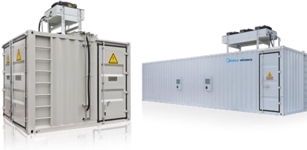
图3 高压无功动态补偿装置

公司生产的SVG主要应用于风电、光伏、冶金、矿山等领域。2021年12月，由公司自主研发生产的首台两套SVG动态无功补偿装置在陕西省吴起县60MW分散式风电项目中成功投运。