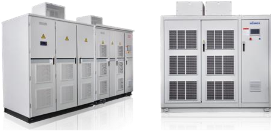
图1 高压变频器系列

(2) 低压变频器： 低压变频器是一种电压等级不高于690V的可调输出频率交流电机驱动装置。公司生产的相关产品包括低压变频器、伺服驱动器、一体化专机等。其应用于大部分的电机拖动场合，能够实现工艺调速、节能、软启动、改善效率等功能。公司拥有施工升降机驱动器、高性能矢量变频器、伺服器和永磁同步电机控制等核心平台技术。产品在电梯升降机、化工注塑、纺织机械、建材、包装机械、数控机床、畜牧养殖等行业得到了广泛应用，其中电梯升降机、物料提升机产品因其智能、稳定的特性，在细分行业中处于头部地位。