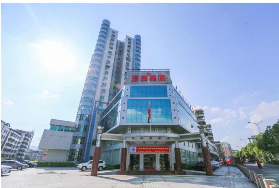
（塔牌集团办公大楼）

广东塔牌集团股份有限公司（下称：“公司”或“塔牌集团”）是一家国家水泥工业结构调整重点支持的大型水泥企业，2021年被评为中国水泥上市公司综合实力排名第11位（来源：数字水泥网）；位居广东企业500强第237位、广东制造企业100强第89位（来源：广东省企业联合会、广东省企业家协会）。公司总部位于广东省梅州市，2008年5月16日在深圳证券交易所上市，证券代码：002233，证券简称：塔牌集团。