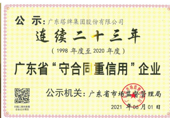
(2020 年度梅州市扶贫济困红棉杯金杯) (连续 23 年广东省‘守合同重信用’企业)