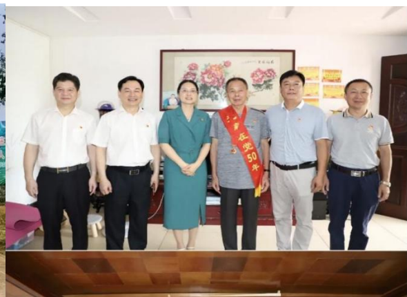
（慰问集团 50 年党龄老党员）

企业文化建设是促进企业发展的动力。2021 年，公司坚持把丰富员工精神文化生活当作一项重要的工作来抓，在元旦、“五一”“五四”等节假日期间，公司认真组织开展职工男子拔河比赛、篮球赛、羽毛球赛、乒乓球赛、游园会等形式多样的活动，不断丰富职工文体活动的形式和内容。展示了塔牌人热爱祖国、爱岗敬业、勇于拼搏、开拓进取的精神风貌，增强了企业凝聚力和向心力，营造了良好的企业文化氛围。