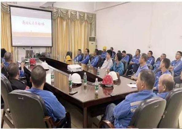
（观看党史题材电影《我的父亲焦裕禄》）

在元旦、春节、七一等重大节日期间，公司及各单位党政工团妇都组织开展对困难党员、困难职工的帮扶和慰问活动。农历春节和七一建党节期间，公司党委领导会同上级领导走访慰问了公司 50 年党龄以上离退休老党员、困难党员和留梅过年的异地员工代表，为 50 年以上党龄的离退休老党员颁发“光荣在党 50 年”纪念章，春节、七一两节共为 50 年以上党龄的离退休老党员、退休党员及困难党员发放慰问金共计 112,400 多元。