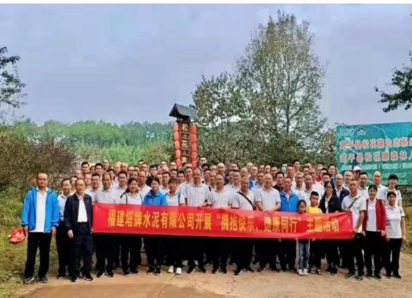
（举办“拥抱快乐，健康同行”主题活动）