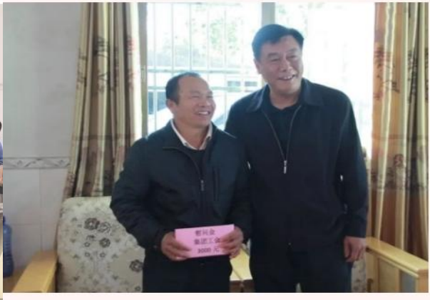
（慰问困难党员、困难职工）