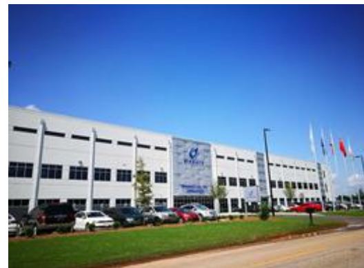
图 8：MingHua USA Inc.