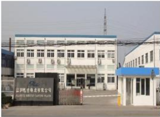
图 5：江阴德吉铸造有限公司