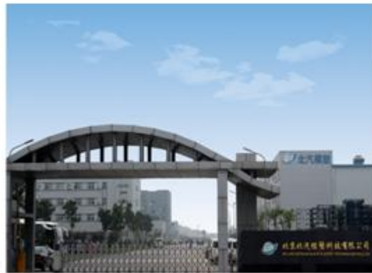
图 6：北京北汽模塑科技有限公司