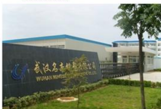
图 3：武汉名本模塑有限公司