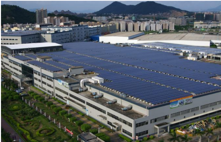
伟创力珠海工业园太阳能光伏发电项目