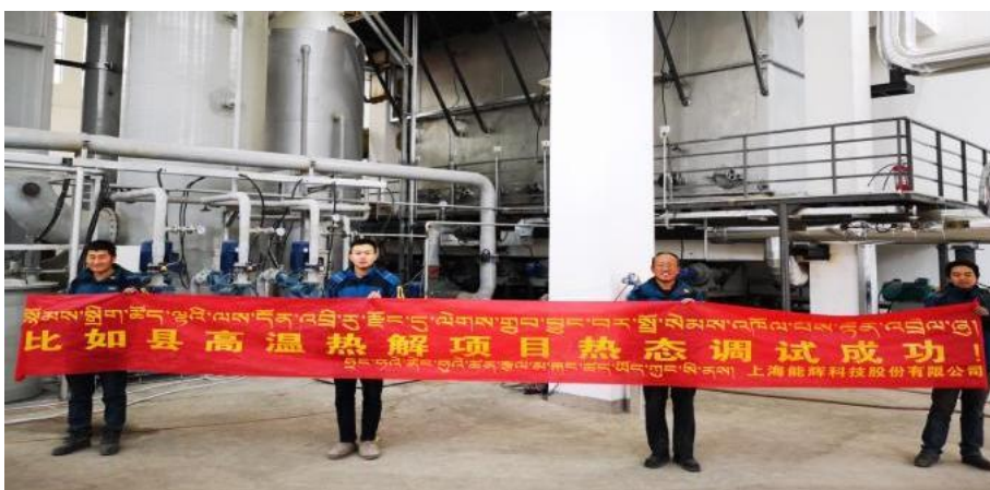
西藏比如县高温热解项目热态调试成功

该系统成功应用于西藏生活垃圾减量化处理试点项目——比如县、班戈县垃圾高温热解项目中，比如县高温热解项目已进入热态试运行阶段，该模式将在中西部广泛推广，未来市场空间大，将是“美丽乡村”建设的重要技术手段和路径。