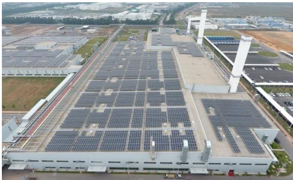
广汽丰田汽车有限公司第三生产线分布式光伏电站项目