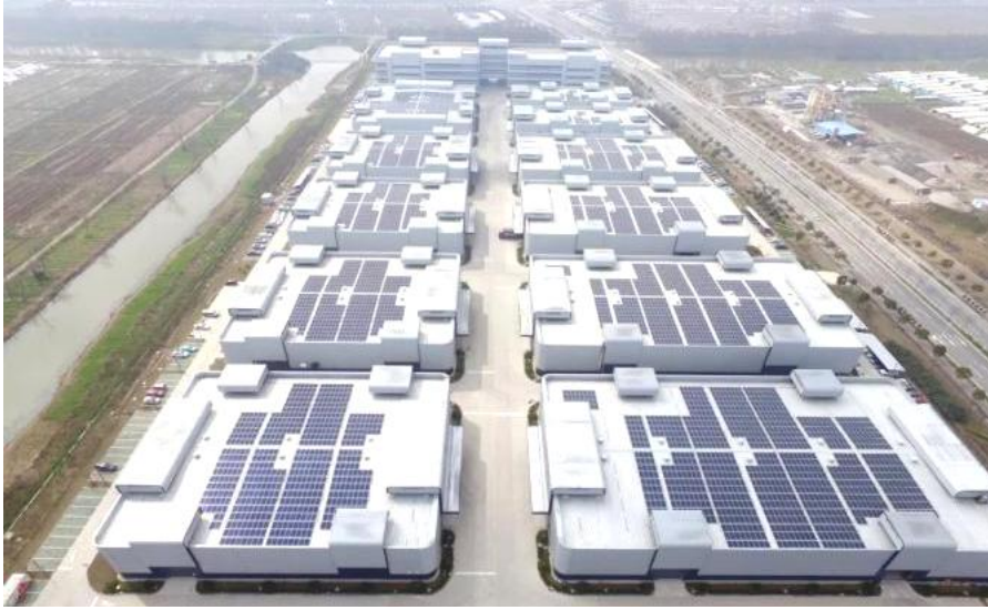
上海临港弘博新能源发展有限公司分布式光伏发电项目