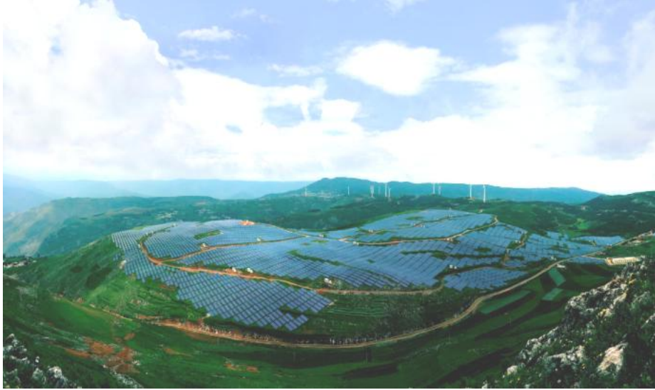
贵州省威宁县平箐 30MW p 光伏电站项目

截至目前，公司积累了国家电力投资集团有限公司、中国电力建设集团有限公司、广州发展集团股份有限公司、中国能源建设集团有限公司、中国广核集团有限公司、国家能源投资集团有限责任公司相关下属企业等优质客户群体。