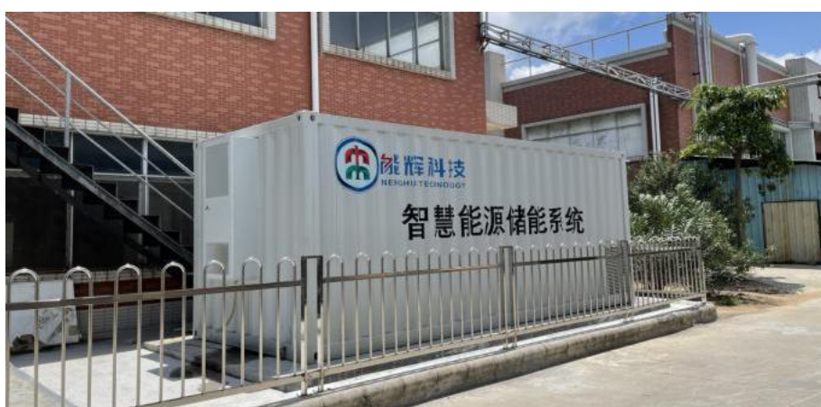
珠海储能系统示范工程

公司开发的 1MWh 储能系统示范工程已经应用于珠海分布式电站中，目前处于试运行阶段。同时，在光储充一体化领域，公司已有部分项目进入前期洽谈阶段，主要内容包括光储充项目的系统设计、设计研发与实施等。