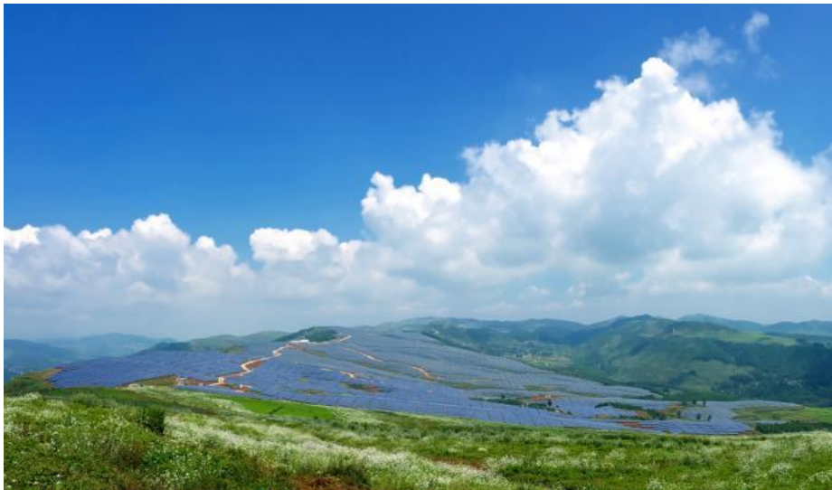
贵州省威宁县么站 60MW p 农业光伏电站项目