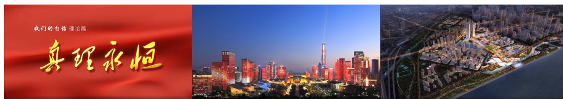
十九大“我们的自信”系列之“真理永恒”