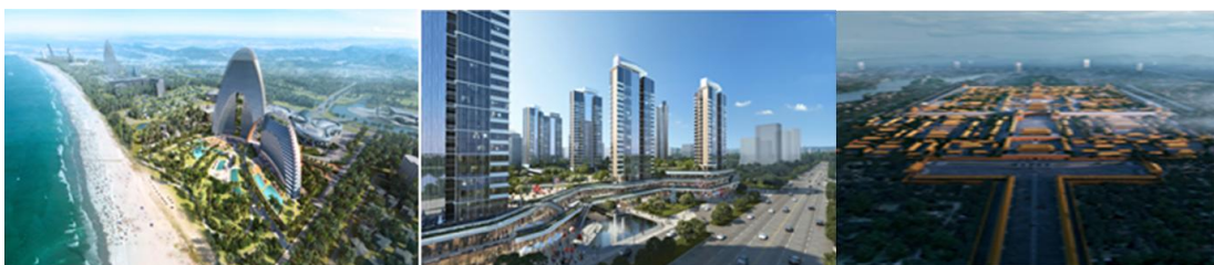
三亚国际免税城项目