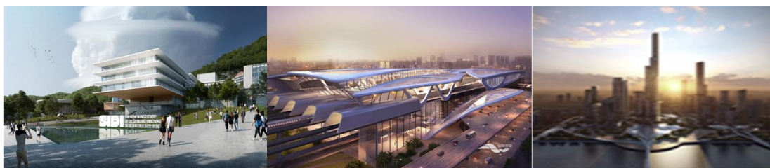
深圳创新创意设计学院方案设计