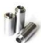
汽车发动机泵套筒系列