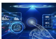
- 智能点巡检 -