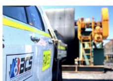
- 总包服务管理 -