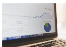
- 管理驾驶舱 -