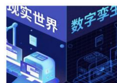
- 数字孪生平台 -