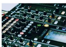
- 智能在线监测 -

作为国内工业散货物料输送系统总包服务的领跑者，在输送带数字化升级、输送系统运行在线监测等方面的研究与应用处于行业领先地位。公司旨在帮助用户企业解决生产输送环节数字化运营及监测的“最后一公里”，为用户达成全流程、全链路数字化运营、安全生产实时监测的目标。公司聚焦物料输送领域，为用户提供生产所需的管理应用系统，提高用户现场的管理水平，主要业务应用为智能在线监测、智能点巡检、总包服务管理、管理驾驶舱和数字孪生平台等。