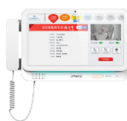
HL3款 护士站主机 15.6寸