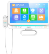
HL3款 床旁终端 15.6寸