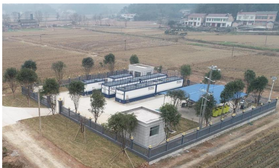
泥窝潭镇污水处理厂实景图