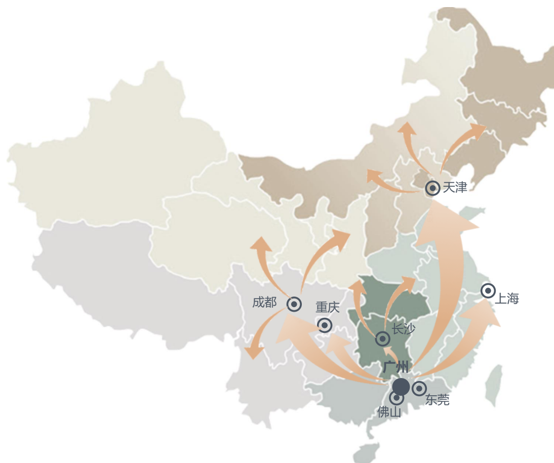
公司营销网络情况

得竞争的关键因素。而受纳米二氧化硅产品应用领域广泛，下游客户所在地较为分散的行业特点影响，拥有一个可以覆盖目标客户的完善营销网络，则成为纳米二氧化硅生产商形成快速客户响应能力的前提条件。