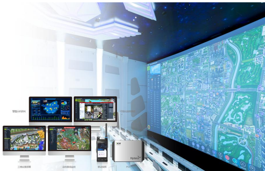
指挥调度平台产品族

在应急通信领域，公司推出了一系列现场应急解决方案，包括窄带自组网产品、宽带自组网产品、手提应急指挥箱、应急指挥业务平台等，成为消防救援、林业防火、电力巡检、自然灾害救援等场景中音视频指挥调度保障的重要支撑手段，具有快速部署、多融合联动指挥、公专融合、宽窄融合等特点。