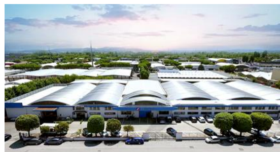
意大利研发制造基地