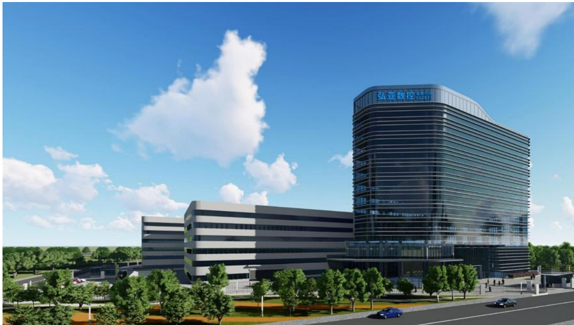
广州研发及管理总部

公司自上市以来，利用资本市场平台，充分发挥了自身资源整合及外延并购能力，相继收购了意大利MASTERWOOD、丹齿精工、王石软件，参股中设机器人、赛志系统。构建了向上延伸，横向并购的发展布局，初步形成了核心零部件、数控家具机械专用设备、工业机器人系统集成的产业链协同战略规划。目前公司在全球设立了广州研发及管理总部、广州总装基地、广州结构件制造基地、意大利研发制造基地、成都总装基地及四川精密零部件生产基地。