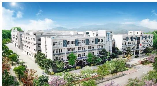
广州结构件生产基地