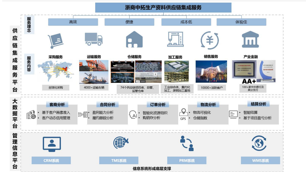
图 1：公司业务模式概览

核心客户，集成公司各项供应链管理服务，以核心客户上下游供应链为主链，逐步拓展供应链子链产品，从而实现产业链全覆盖。目前，公司已在光伏、锂电等新能源业务领域展开深入业务布局。