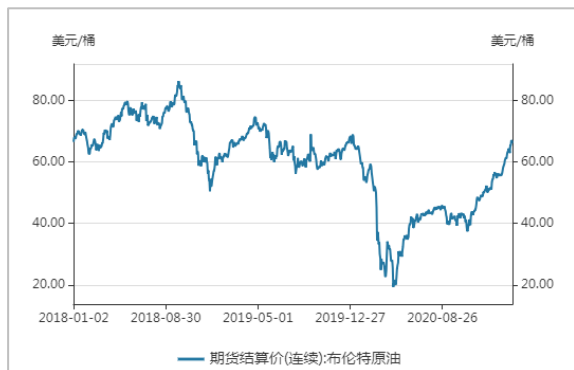
图3 布伦特原油期货结算价格