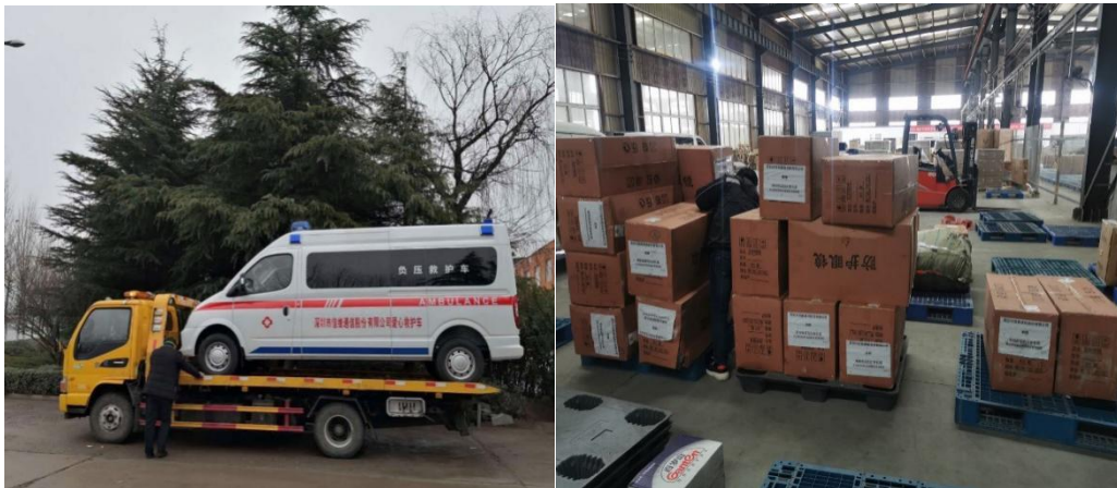
（公司为疫情地区捐赠的负压救护车）

2020 年伊始，新冠肺炎来势汹汹，突袭荆楚、蔓延全国，传播速度之快，威力之强，影响之大，令我国人民遭受其害。从雨雪纷飞到蝉鸣萤飞，城市在艰难中重启复苏的危急之际，党和政府带领人民万众一心齐抗疫。企业作为社会的组成部分之一，无法脱离社会而独存，在疫情铺天盖地袭来之时，积极履行“企业社会责任”响应国家号召，回馈社会。在疫情刚被确认的前期，信维通信动用各项资源为战疫作贡献，以最快的速度将急需的医疗物资送达武汉前线。新冠肺炎疫情期间，公司向社会捐赠新冠肺炎防疫负压隔离舱救护车 1 辆；医用外科口罩 5 万只；隔离防护服 5000 套；医用护目镜 5000 套。