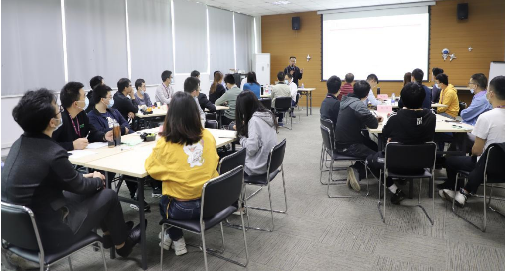
（员工参与安全生产培训讲座）