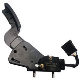
踏板式电子油门踏板总成