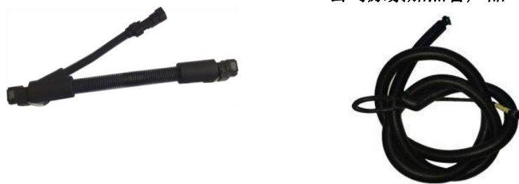
公司尿素加热管产品

公司于2008年开始进行尿素加热管产品的研发，目前已建立起完整的设计开发流程。产品已通过陕汽集团在黑河的试验，开始批量投入市场。目前，该产品已进入中联重工和陕汽集团等厂家。