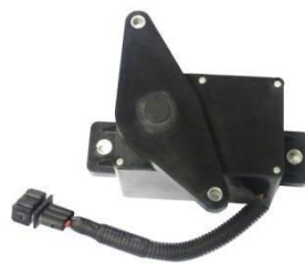
手动式电子油门踏板总成