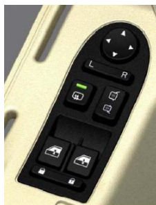
应用于乘用车的门窗控制器