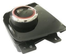
旋钮式电子换挡器