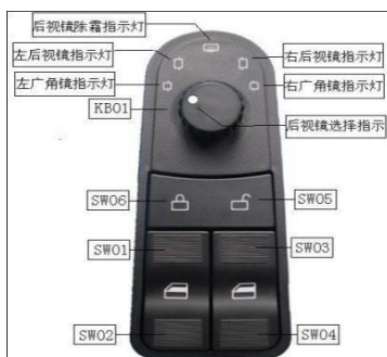
应用于商用车的门窗控制器