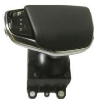
档杆式电子换挡器