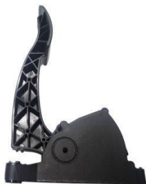
悬挂式电子油门踏板总成