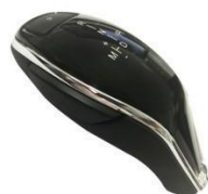
手球式电子换挡器