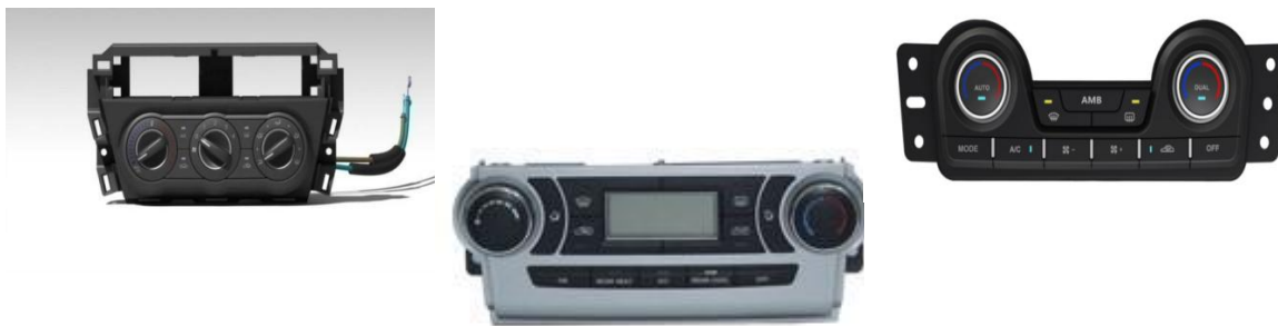
手动机械式空调控制器