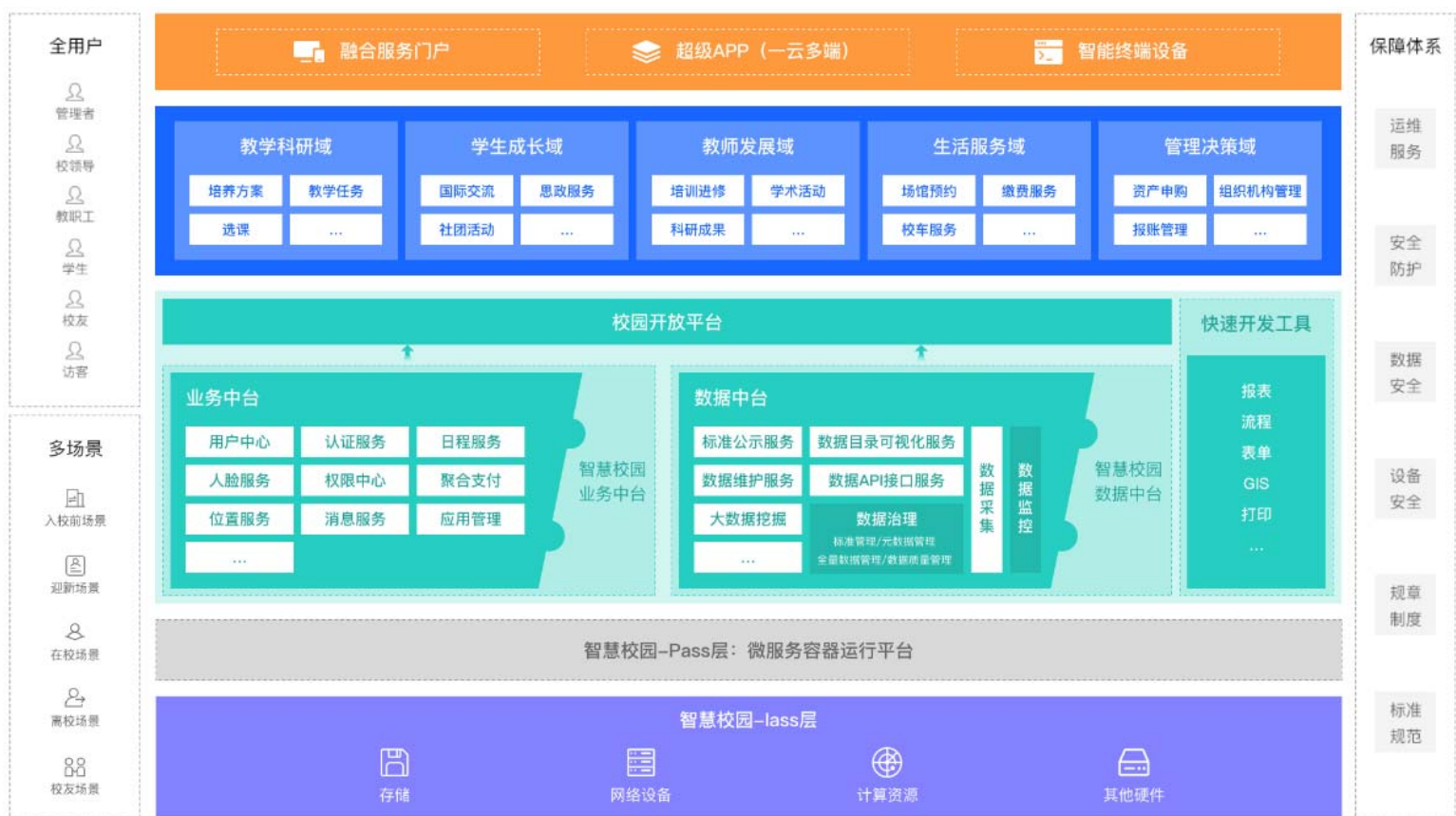
图二 智慧校园总体框架设计与解读

公司秉承“大平台+微应用+开放生态”的核心思想，以公共中台型数字化校园建设为基础，建立支付、权鉴、数据、学习过程管理等共享开放能力平台。围绕师生在教学科研、学生成长、教师发展、生活服务、管理决策等各个领域的需求，为学校提供管理和教学等各类智慧校园应用，通过融合服务门户、超级App、智能终端设备等多样化的服务入口，向师生提供教学、管理、学习、就业、生活等全方位服务。