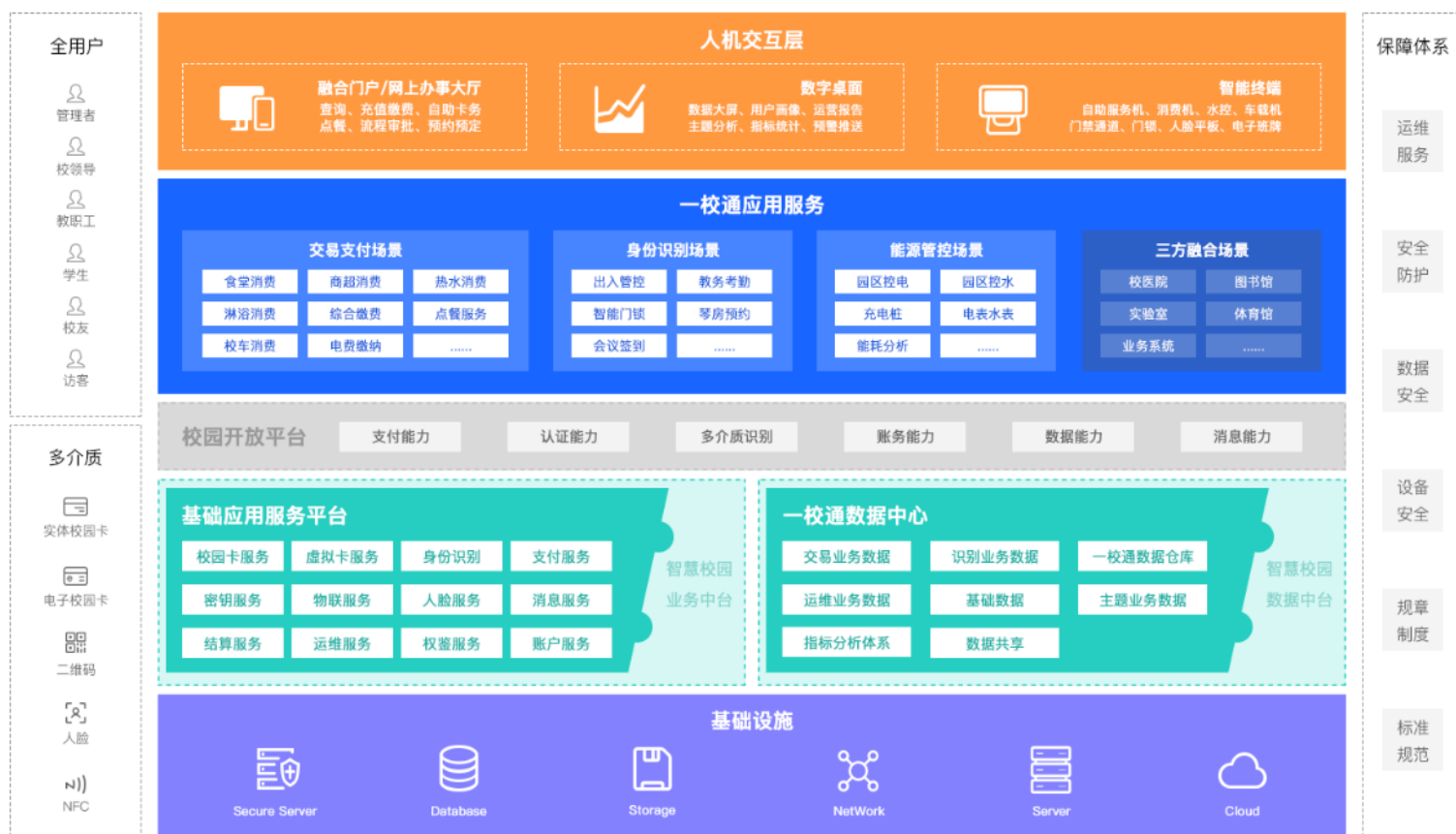
图一 高校智慧校园码卡脸一校通解决方案

在《高等学校数字校园建设规范》《智慧校园总体框架》指导下，结合众多客户共创和公司20余年高校信息化领域建设经验，将高校金融交易、身份识别、数据应用的统一能力建设和信息资源整合，形成理念先进、技术可靠、产品易用的码卡脸一校通整体解决方案。