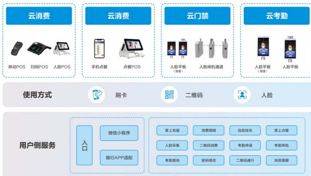
图六 新开普“政企云”功能架构图

通过移动互联网技术，打造虚拟卡一卡通平台，企业职工使用员工卡外，同时支持二维码、生物识别，完成交易支付、身份识别等业务。借助4G技术、聚合支付、生物特征识别、智能手机设备等工具，提供满足企业个性管理、全业务场景覆盖的解决方案，让职工们在企业得到更好的生活和服务体验。