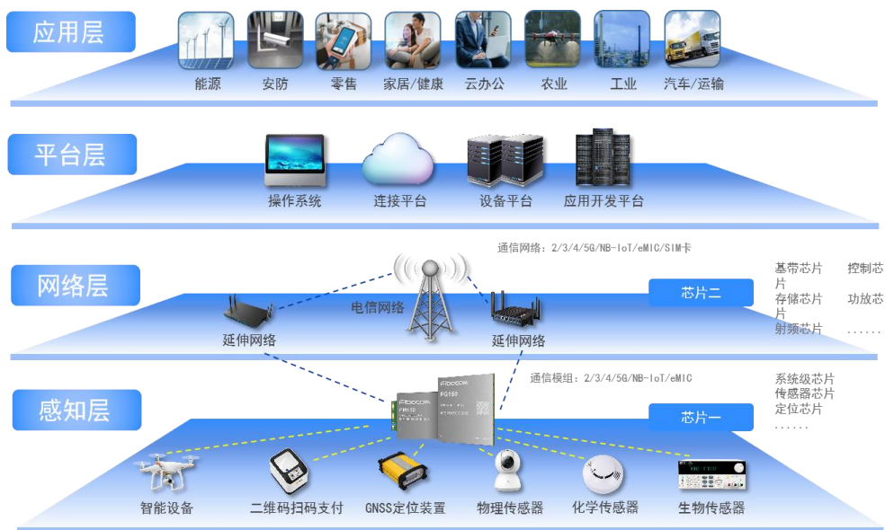
图1：物联网产业链及架构

公司自成立以来一直致力于物联网与移动互联网无线通信技术和应用的推广及其解决方案的应用拓展，在通信技术、射频技术、数据传输技术、信号处理技术上形成了较强的研发实力，是无线通信技术领域拥有自主知识产权的专业产品与方案提供商。公司在物联网产业链中处于网络层，并涉及与感知层的交叉领域，主要从事无线通信模块及其应用行业的通信解决方案的设计、研发与销售服务。