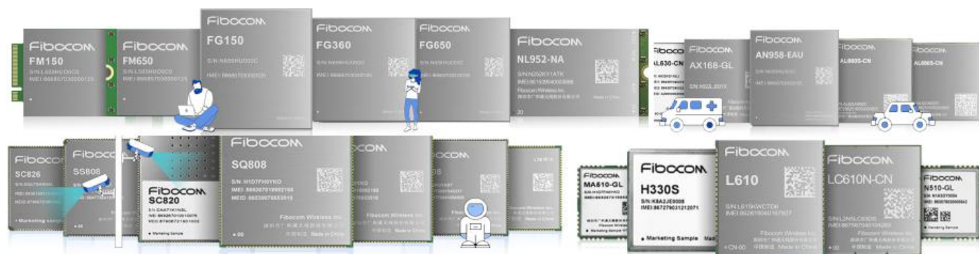
图2：公司主要产品图片

公司自成立以来一直致力于物联网与移动互联网无线通信技术和应用的推广及其解决方案的应用拓展，在通信技术、射频技术、数据传输技术、信号处理技术上形成了较强的研发实力，是无线通信技术领域拥有自主知识产权的专业产品与方案提供商。公司在物联网产业链中处于网络层，并涉及与感知层的交叉领域，主要从事无线通信模块及其应用行业的通信解决方案的设计、研发与销售服务。