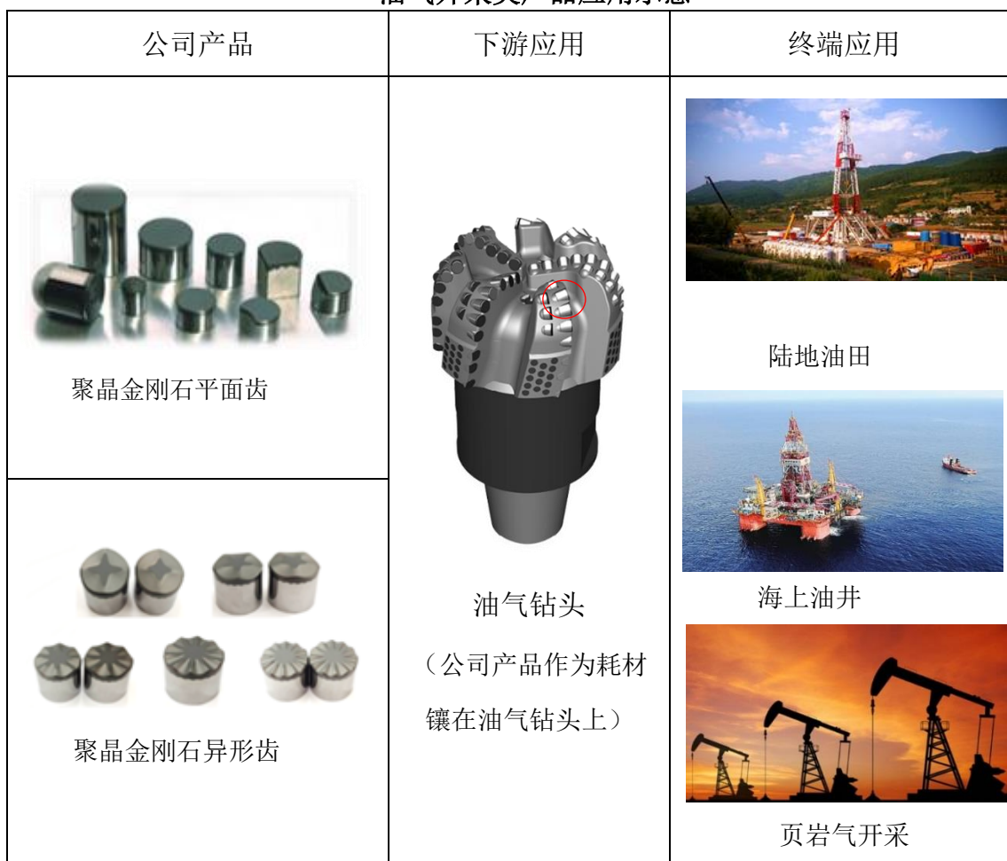
油气开采类产品应用示意

公司目前已经形成较为完整的产品体系，应用地层涵盖软地层、中硬层、硬地层、含砾地层等所有地质结构的平齿、异形齿产品组合，在油气勘探与开采作业中表现优异。公司近年推出一系列新产品享誉国内外，进一步巩固公司石油/天然气钻探用金刚石复合片的高端齿地位，打破国内高端齿以进口为主的竞争格局，成为进口石油/天然气钻探用金刚石复合片高端齿的强劲对手，大幅降低国内油气开采成本。