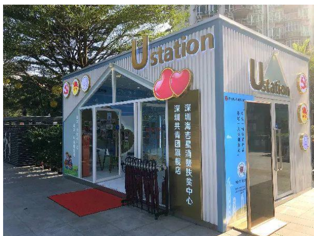
图四：深圳海吉星消费扶贫中心 深圳共青团旗舰店

油、猪肉、百香果等受到了广大员工的喜爱。与此同时，公司还协助深圳团市委、市扶贫办在公司物业星海名城商业广场开设扶贫产品销售旗舰店，大力宣传和推广扶贫产品，增加了贫困户及村集体的收入。