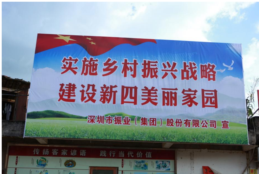
图八：实施乡村振兴 建设美丽家园

脱贫攻坚是一项历史性工程，是中国共产党对人民作出的庄严承诺。在这场扶贫攻坚战中振业作为深圳市国资委的直管上市企业，我们派出专人、支出专项扶贫资金，帮助扶贫村寻找扶贫产业转型升级，开展消费帮扶，基础设施建设、环境整治等，为全国的减贫事业贡献“振业力量”。下一步，我们还将继续关注对口扶贫情况，巩固拓展脱贫攻坚成果，执行好防止返贫监测帮扶机制，助力乡村振兴战略实施，竭尽全力为全国的减贫事业贡献“振业力量”！