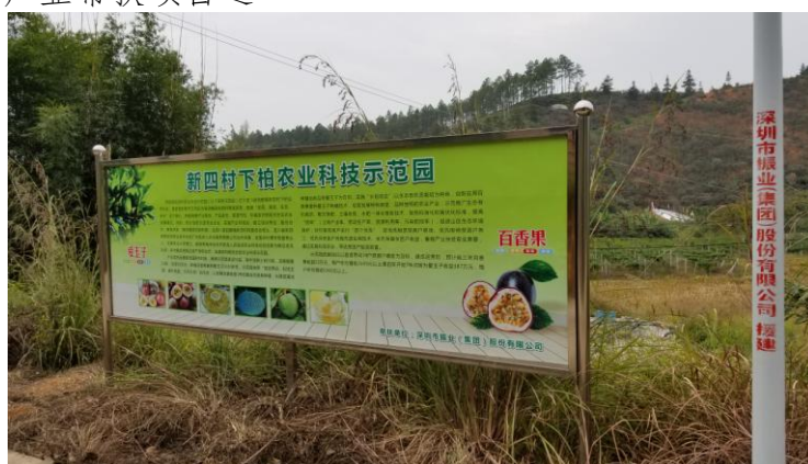
图三：新四村产业帮扶项目之二