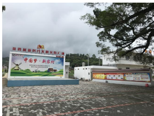
图五：新建成的村文体广场

扶贫期间，公司先后投入扶贫资金 438.79 万元，用于路桥工程建设、兴修农田水利设施、兴建照明工程及治安工程、建设新四村新时代文明实践广场、改造提升村党群服务中心等，为村民出行、务农劳作、娱乐休闲，便捷办公等提供便利，满足了村民文化生活需求，展示了新四村焕然一新的精神面貌。