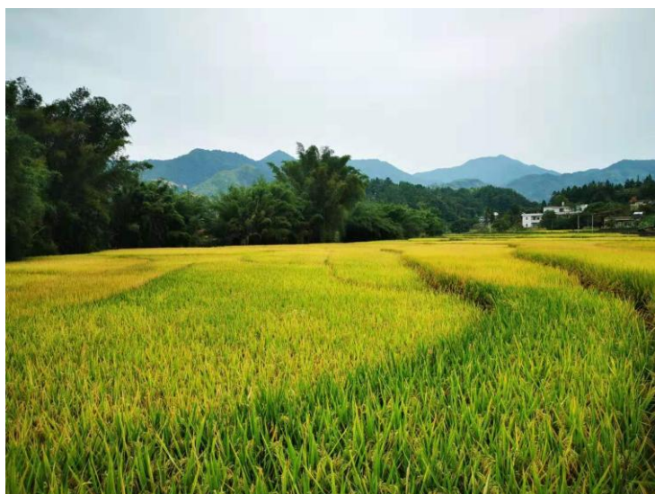
图六：改造后的美丽村庄

公司将新四村人居环境改善列入扶贫攻坚期计划，稳步推进新农村示范村建设，协助相关行业部门完成村内交通运输、安全饮水、电网改造、网络信息基础设施建设，开展新四村环境综合整治工作，清理河道淤泥、村道杂草、生活垃圾，建设垃圾填埋场，开展“厕所革命”、污水治理、村庄绿化美化行动，改善新四村生产生活条件和人居环境。2020年3月，新四村荣获“河源市文明村镇”称号。