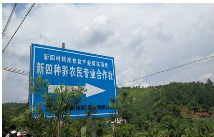
图二：新四村产业帮扶项目之一

带领村民发展百香果种植产业，并通过转包经营等方式对风险进行转移，村集体每年固定收入进一步增加；带领贫困村开展“合作社+致富带头人+家庭农场”的创新养鸡产业模式，选取致富带头人逐渐扩大养殖规模，打造星级“家庭农场”，带动贫困村积极发展养鸡产业。此外，我们还通过帮助重点贫困户发展皇帝柑产业，培育发展龙川县新四种养农民专业合作社，多渠道增加村集体收入。