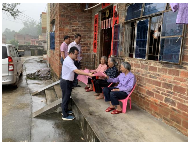
图七：驻村干部到户宣传扶贫政策

公司积极推动扶贫政策落地，确保政策落实到人、落实到户。截至2020年，新四村100%落实最低生活保障政策、养老及医疗保险政策、教育补助政策，并全面完成危房改造指标任务。