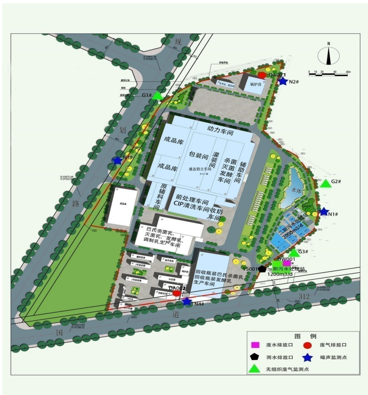
图1-3 监测点位示意图