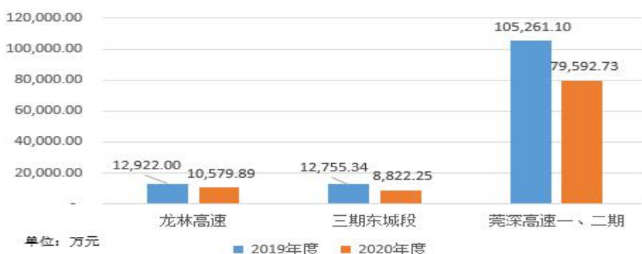
莞深高速各路段通行费收入对比图

按季度对比数据统计，2020 年 2 月 17 日至 5 月 5 日，全国高速免收通行费，因此 2020 年第一季度、第二季度通行费收入较往年大幅下降。但随着疫情得到有效控制，第三、第四季度莞深高速全线的通行费收入较 2019 年同期仍实现了小幅增长。