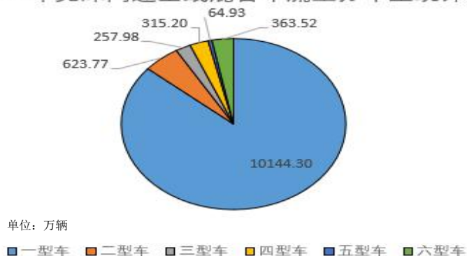
2020年莞深高速全线混合车流量分车型统计图

报告期，莞深高速全线合计实现通行费收入 9.90 亿元，同比下降 24.40%，其中莞深高速一二期、三期东城段及龙林高速分别实现通行费收入 7.96 亿元、0.88 亿元、1.06 亿元，分别同比下降 24.39%、30.83%、18.13%。通行费下降主要是根据交通运输部发布的《关于新冠肺炎疫情防控期间免收收费公路车辆通行费的通知》，全国高速公路施行 79 天的免收通行费政策。