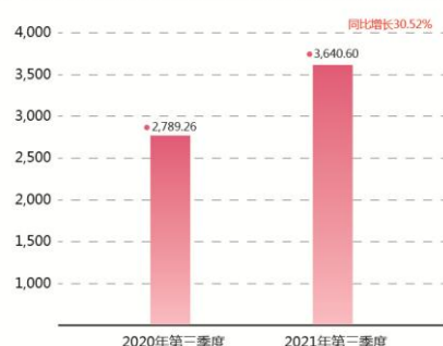
第三季度归属于上市公司股东的净利润同期对比（万元）