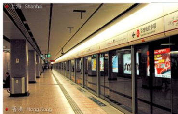
上海地铁中使用公司的防火防爆地铁屏蔽门系统