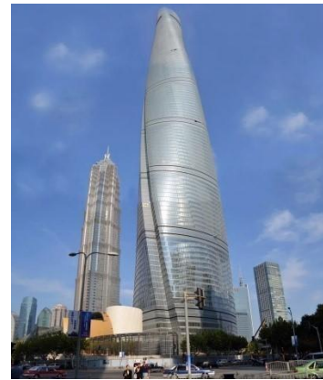
上海中心大厦使用的 防火玻璃幕墙