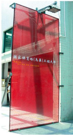
公司鸟巢工程大样