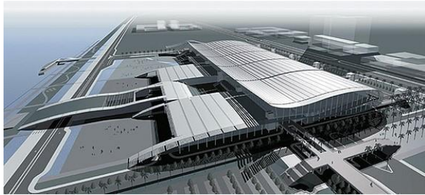
广州国际会展中心使用大面积的 高强度铯钾防火玻璃及Low-E防火玻璃