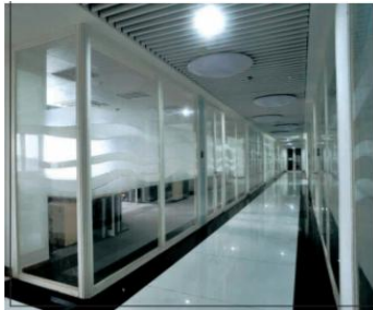
钢制防火玻璃门及隔墙

公司防火玻璃系统产品主要包括钢质防火玻璃及隔墙、隔热钢制玻璃门及隔墙、不锈钢防火玻璃门窗及隔墙、钢质节能防火窗、防火玻璃幕墙、单元式防火玻璃幕墙钢铝系统及高强度单片低辐射镀膜防火玻璃等。