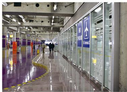
首都机场三号航站楼地下停车场使用公司防火中空玻璃隔断（带钢框架防火玻璃门）

截至2019年12月31日，公司承担过30多项国家级、省级科技项目；10项产品通过科技成果鉴定，其中8项产品综合技术达到国际先进或国内领先水平；列为国家重点新产品6项。