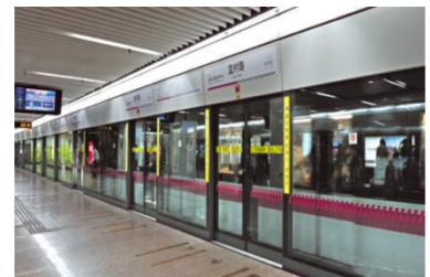
香港地铁中使用公司的防火防爆地铁屏蔽门系统