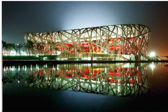
国家体育场（鸟巢）使用公司的彩釉钢化玻璃