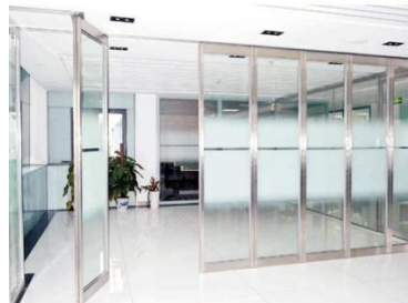
不锈钢防火玻璃平移门