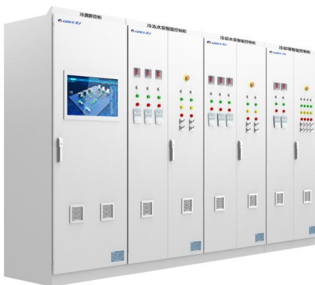
图 6：横琴新区智慧能源管理系统

国家成都新药安全性评价中心是目前国内规模最大的新药临床前研究技术服务的专业机构，对室内环境控制的稳定性和安全性有极高的要求，格力采用高效永磁同步变频离心机为核心的高效系统解决方案，得到用户的认可。目前，该技术已广泛应用于轨道交通、区域能源、数据中心、医药建筑、养殖业、酒店、写字楼等领域。