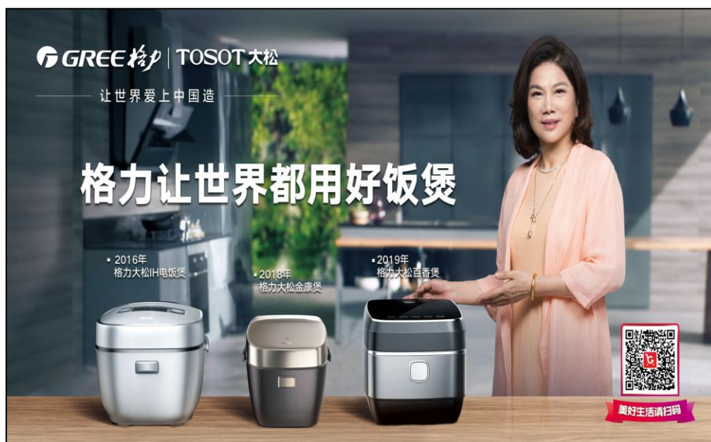
图 7：格力 IH 电饭煲

色煲仔饭、发芽糙米饭、快煮粥等特色功能，搭载多段 IH 技术和微压技术，实现米饭均匀烹饪效果。