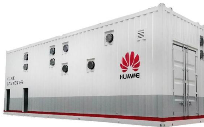
图 5：华为东莞云数据中心高效集成冷站

格力高效永磁同步变频螺杆机为东莞华为云数据中心二、三期项目分别提供 6×750RT 模块化高效集成冷站，实现工厂模块预制，即接即用，制冷机房整体能效达到 5.0 以上，施工时间缩短 80%以上。