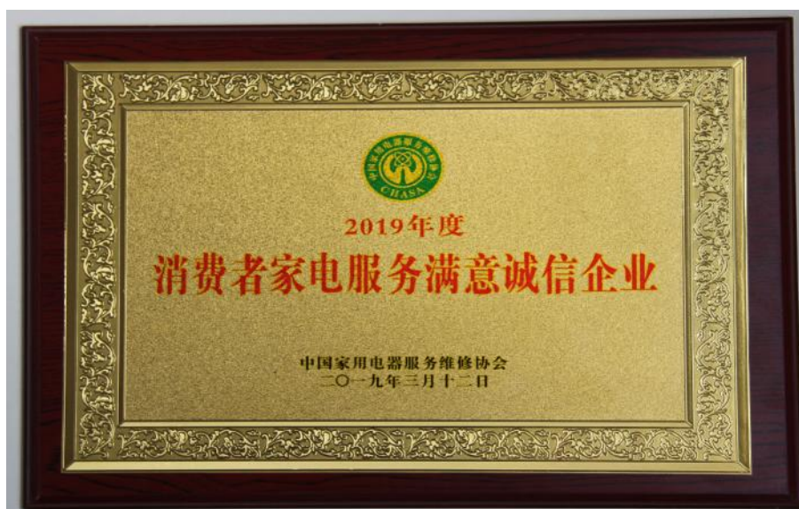
图 16：荣获“2019 年度消费者家电服务满意诚信企业”