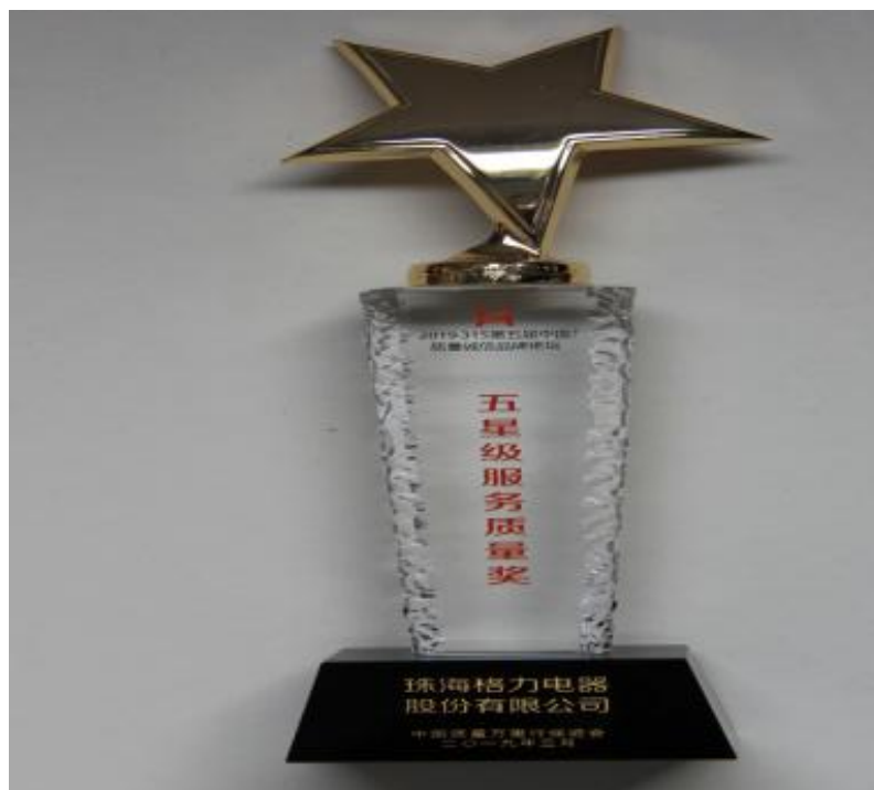
图 17：荣获“第五届中国质量诚信品牌论坛五星级服务质量奖”

在中国质量万里行促进会上，格力电荣获 2019 年度 3.15 “第五届中国质量诚信品牌论坛五星级服务质量奖”。