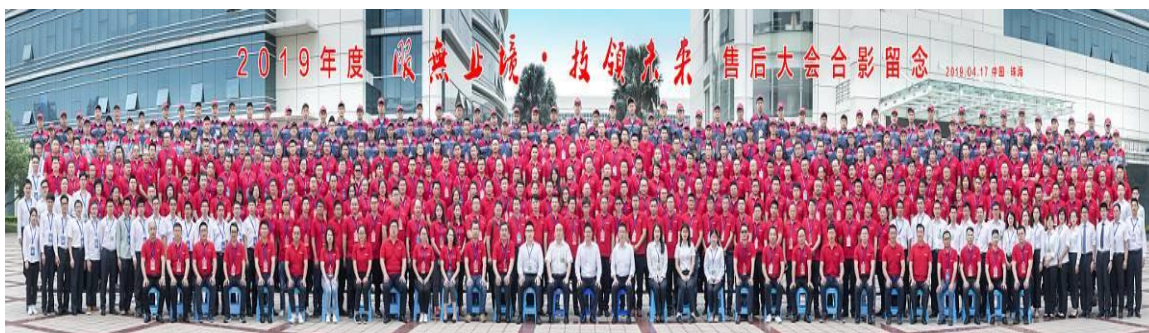
图 13：售后服务人员集中培训

2019 年度，公司组织开展 2019 “GlobalGREE 海外售后训练营”，巡回拉美、北美、东南亚、中东、欧洲等 39 个国家和地区。