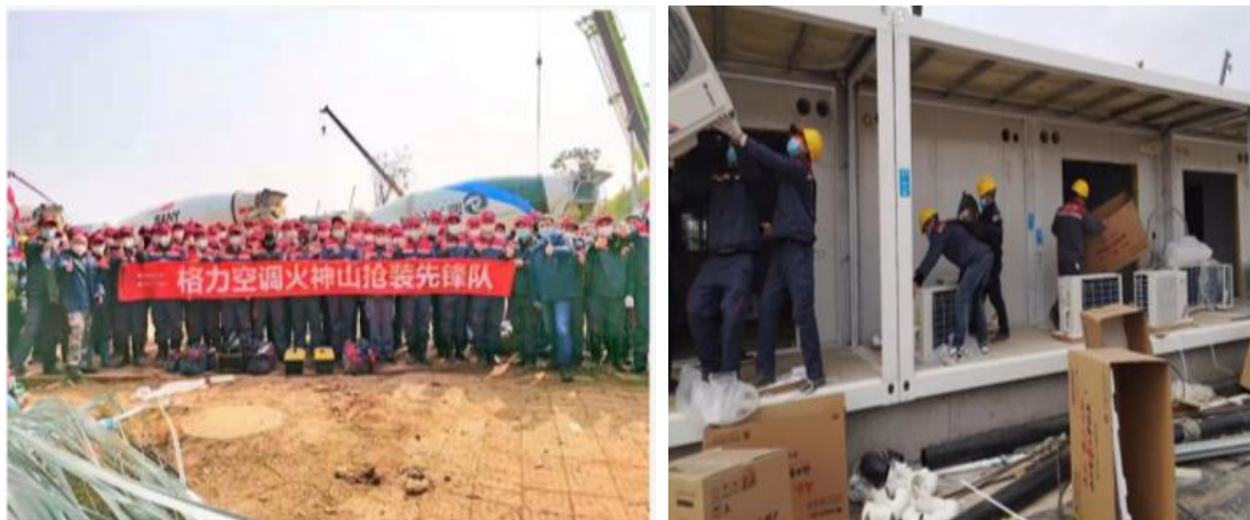
图 25：格力火神山抢装先锋队

在疫情鼎盛期间，各种防疫物资极度匮乏，格力电器积极协调各项资源，向珠海市人珠海市卫生健康局、民医院、中大五院、妇幼保健院等单位捐赠口罩近 5 万枚，协助医疗工作者做好人民健康的救护工作。