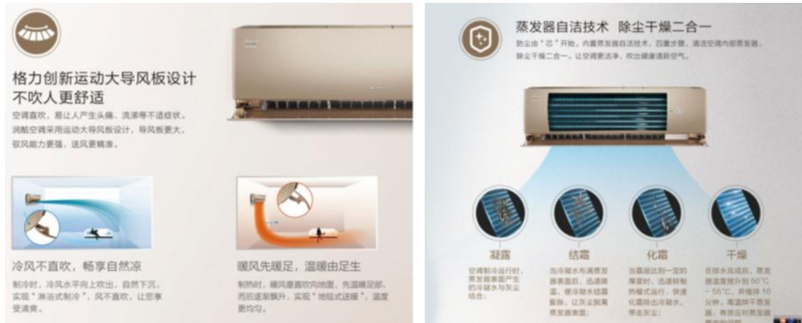
图 3：全新 Pular 分体机

的双导风板，优化气流控制，气流组织更加顺畅、合理，提升用户舒适感；全系列搭载的蒸发器自洁技术，为用户的健康保驾护航；采用简化的整体结构方案，实现无需打开面板即可清洗过滤网、快速分离扫风叶片、扫风连杆、导风板等，达到深度清洁风道、呼吸新鲜空气的目的。