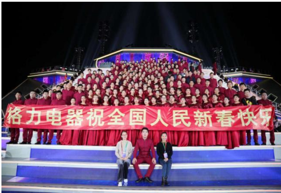
图 23：格力电器员工参与央视春晚节目录制现场

2019年，格力电器组织多样化职工活动，参加上级工会活动组织9项，参与人次达800余人次；策划格力杯主题活动12项，参与人次达10000余人次；组织参加“2019年珠海市庆祝建国70周年大型活动节目录制”、组织参加“2020年中央广播电视台粤港澳大湾区春晚节目录制”等活动，参演职工达2800名，格力职工在录制现场的优异表现，获现场导演的高度赞扬，充分展现了格力人的精神风貌。