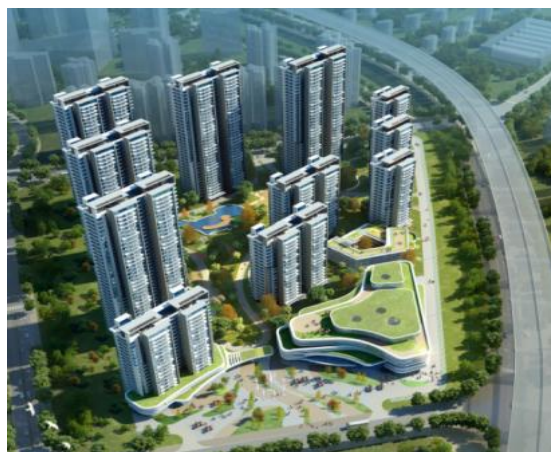
21：格力明珠广场人才公寓（在建）