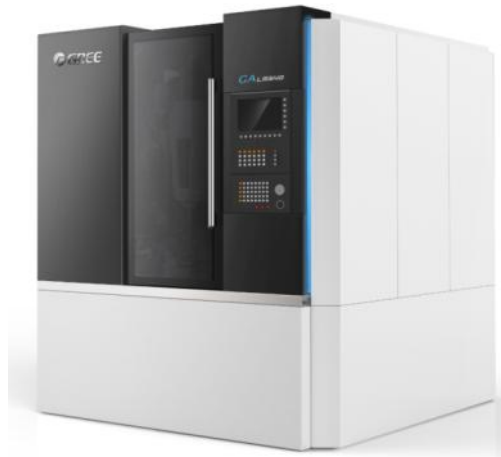
图 11：高精度立式加工中心 GA-LM540

目前，已经批量生产的石墨加工中心是一款精心为用户打造的高性能、高精度的数控车床。机床在设计结构上重点突出了机床的刚性、精度、易操作性、可靠性等用户最为关注的问题，其各方面的指标都是同类产品中的佼佼者。与该行业其它品牌相比，床身采用了矿物铸件，相比传统铸铁床身，无应力变形，结构稳定，减震优良，吸振效果好，能大幅降低振幅和固有频率，还有极好的动态特性和刚性；驱动采用直线电机驱动，加工效率大幅优于丝杆线轨，精度高、密封性好、环保优良。