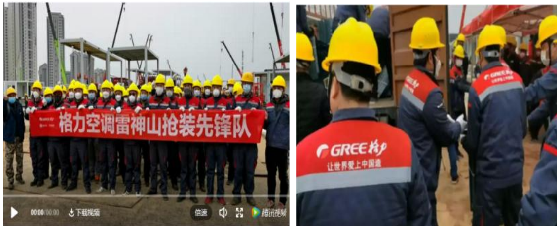
图 24：格力雷神山抢装先锋队

募集善款超过 600 万元，用于湖北疫区购买防疫物资。格力电器国内多个销售公司陆续向各地一线医疗机构捐赠价值超过 1000 万元的杀病毒空气净化器防疫物资；格力 200 多名安装工师傅组建空调抢装“先锋队”，高质量完成雷神山医院和火神山医院空调安装任务；在接到地方政府紧急任务后，19 名焊工主动请缨，组建“突击队”火速驰援雷神山医院，圆满完成南区 15 个分区上千个焊点的焊装工作。