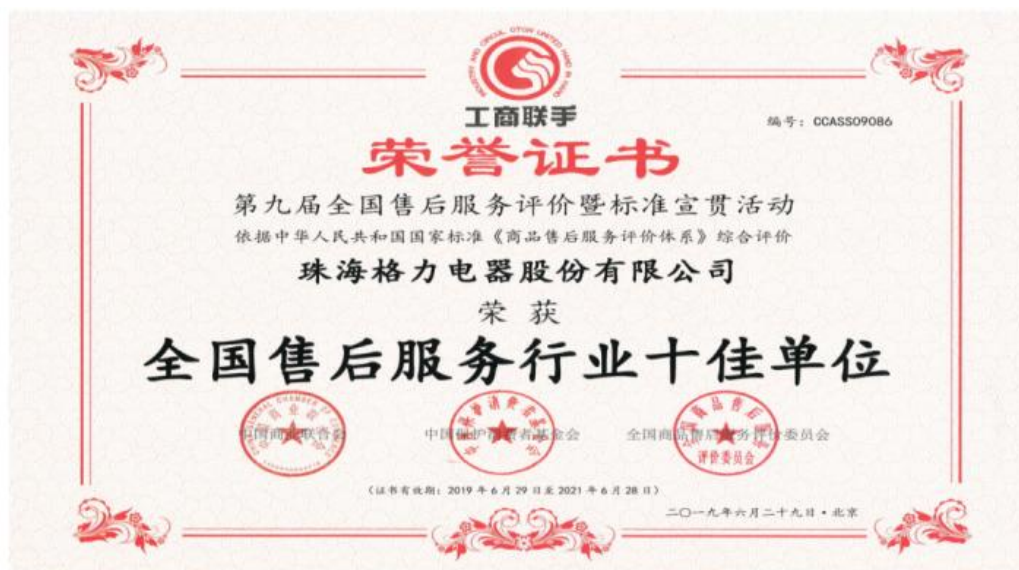
图 15：荣获全国售后服务行业十佳单位

格力电器 2019 年在中国商业联合会、中国保护消费者基金会、全国商品售后服务评价委员会颁发的第九届全国售后服务评价暨标准宣贯活动中荣获“全国售后服务行业十佳单位”。