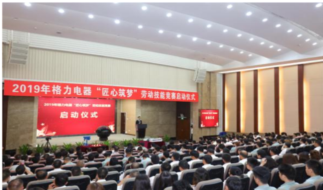
图 18：2019 年格力电器“匠心筑梦”劳动技能竞赛启动仪式

截至目前，全集团技能型人才突破 36600 人，其中 5000 余人评定为中、高级以上技师，多人获得“广东省技术能手、珠海市技术能手、珠海市岗位技术能手、珠海工匠”等称号。