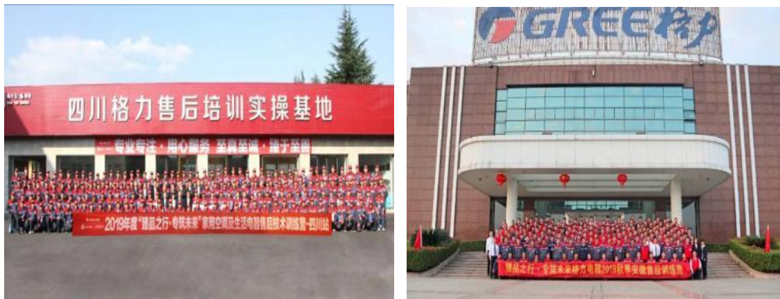
图 12：销售公司售后实操培训

商用空调售后技术训练营通过“理论课堂、互动游戏、案例分享+、实操比拼、知识竞赛、素质拓展、现场访谈”等丰富多样的教学环节，打造“新颖有趣、劳逸结合、荣耀共享、全面提升”的培训课堂，激发学员参与热情和兴趣，增强学习提升成效。累计开展 95 场 6704 人次。