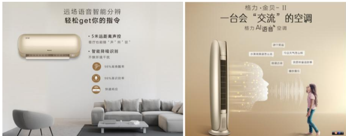
图 2：AI 语音智能空调“金贝”

针对手动遥控空调步骤多、不便捷的痛点，公司开发了物联网空调格力·金贝 II-柜机、金贝挂机（AI 语音款）系列产品，搭载 AI 语音技术，不必动手就能控制空调，还可进行音乐放送、新闻播报、百科查询、聊天等交互功能，还可以联动全屋家电，让空调成为家庭智能终端。