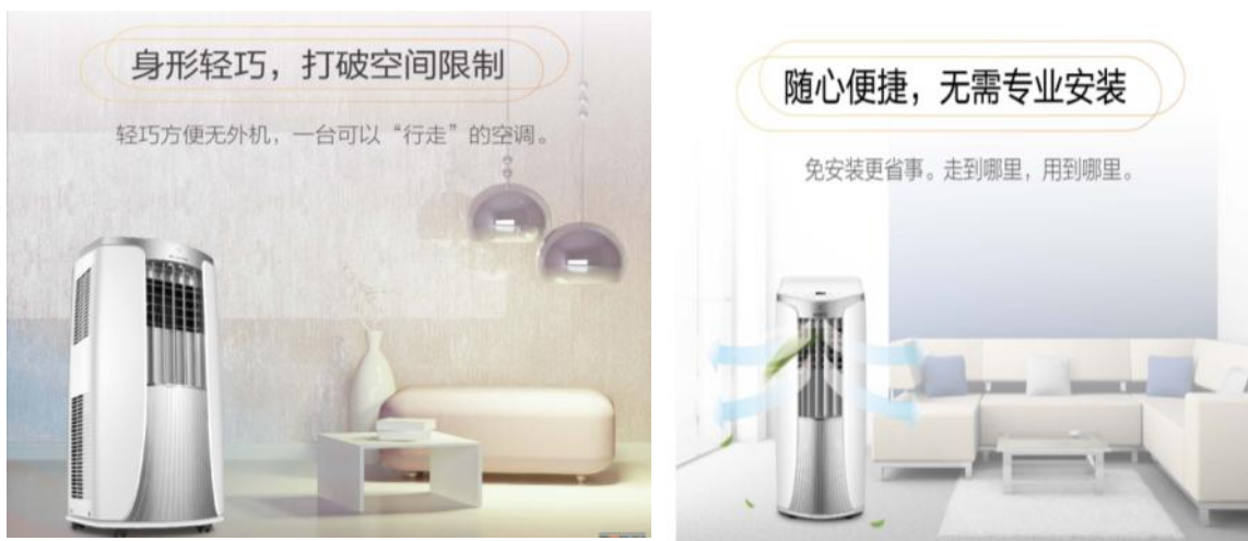
图 4：全新出口欧盟移动式空调

全新欧盟移动机，造型简洁，采用顶部大导风板设计，冷风不吹人，使用舒适。内部采用使用 T 型换热器布局架构，搭配双重冷凝水利用技术，提高制冷能效。采用 R290 环保冷媒，搭配自主品牌的高效压缩机和自主研发的渐进式扩压风道技术，使整机满足欧盟的环保要求及 A 级能效要求，既省电又舒适。