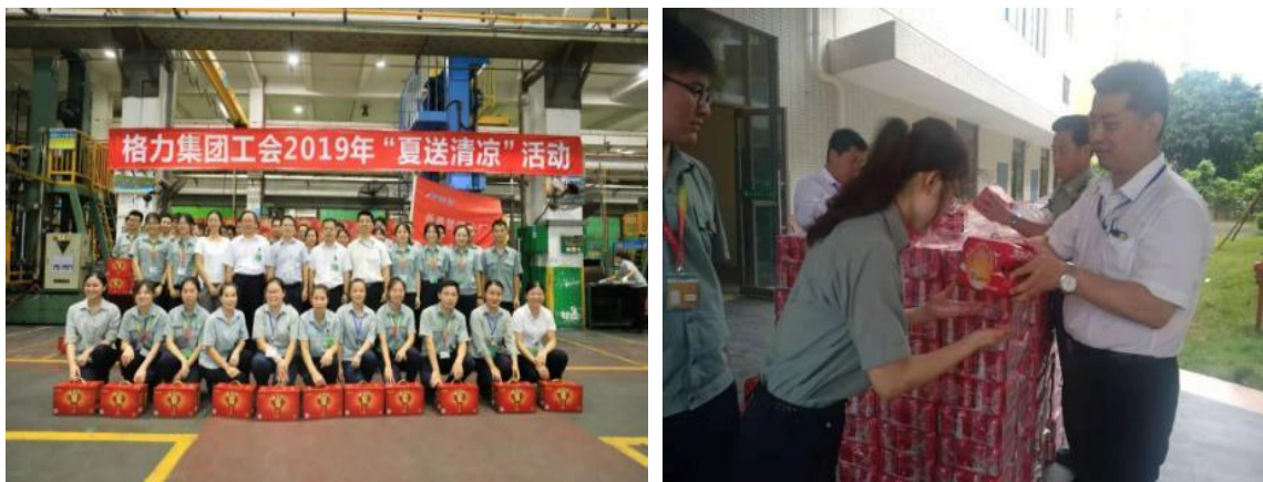
图 22：公司工会为一线员工赠送清凉饮料

格力电器工会坚持开展“夏送清凉”、“四高改善”、“健康周六”等多项劳动保护举措，不断改善员工岗位环境，保护职工身心健康。2019 年，格力电器工会组织送清凉活动人次达 9.5 万次，金额达 521 万元，2019 年五一劳动节、中秋国庆双节期间为全体职工发放慰问品，发放金额达 10643.05 万元。