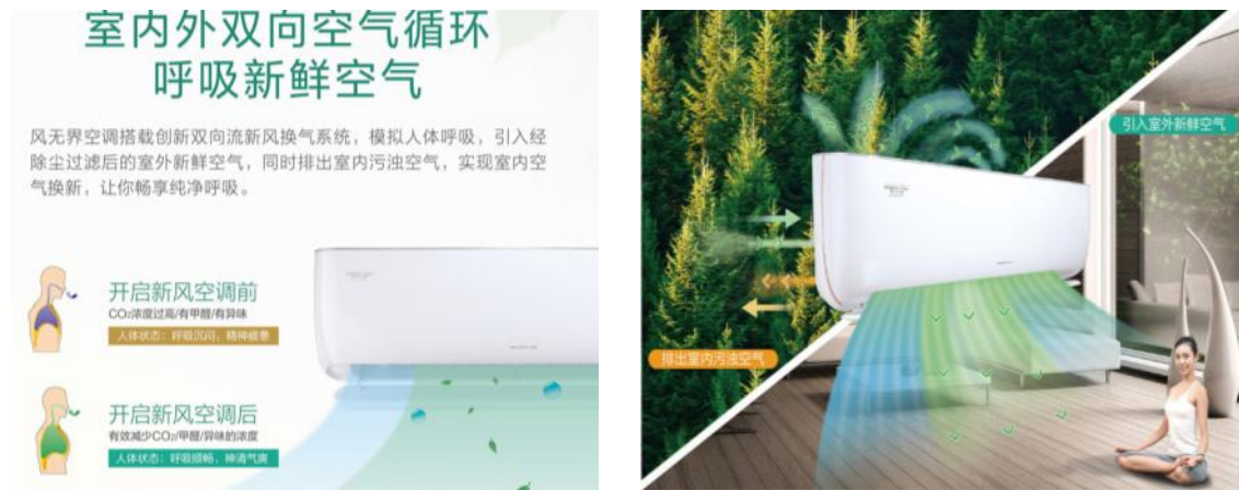
图 1：室内外双向换气的空调“风无界”

高，身体健康受到危害等痛点问题，开发了新风空调“风无界”挂、柜机，具有双向新风功能，既可以引入多重过滤后的室外新鲜空气，还同时排出室内污浊空气，能有效、持久地保持室内空气清新。空调内置空气质量传感器，可监测室内空气质量，新风系统智能开启或关闭，为用户带来便捷、健康的享受。