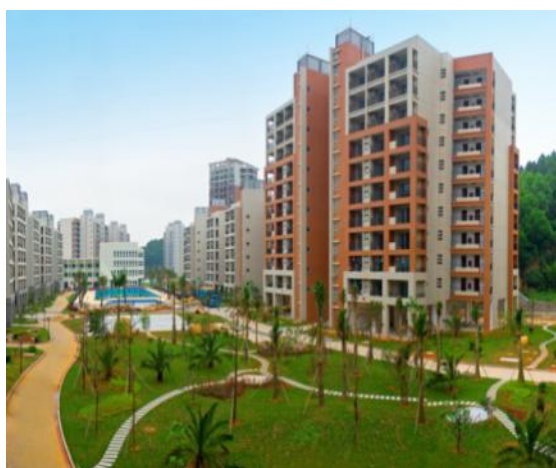
图 20：格力康乐园一期员工生活区图