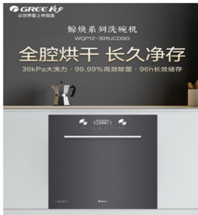
图 10：鲸焕系列嵌入式洗碗机

同时为满足不同用户需求开发小台式鲸云系列洗碗机产品，采用 72℃ 高温洗涤及热风烘干系统，除菌率高达 99.99%。