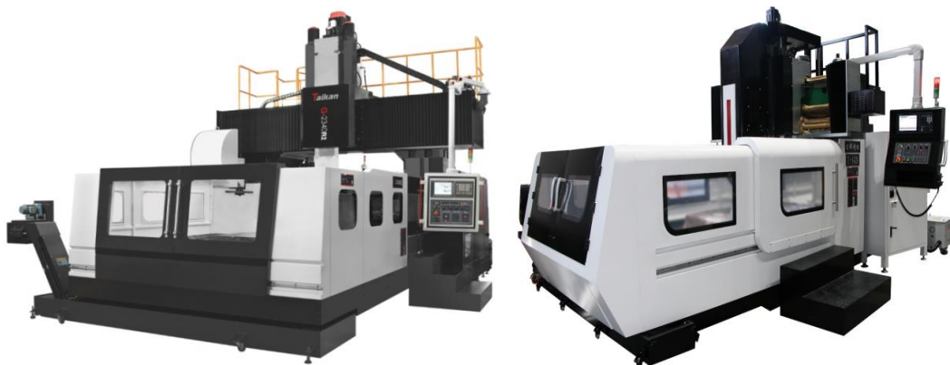
图3-5 龙门加工中心系列产品示例

典型客户： 比亚迪、上汽集团、长城汽车、广汽集团、中国中车、江淮汽车、中航沈飞、中直股份等。