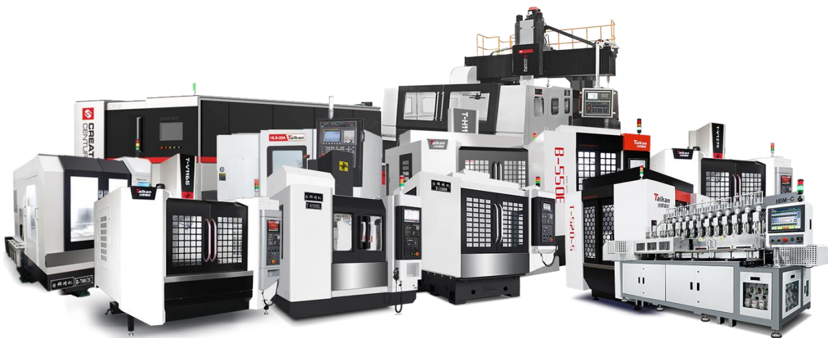
图3-1 公司数控机床系列产品总示

公司产品门类齐全，涵盖金属切削机床、非金属切削机床、激光切割机床等三个主攻方向，细分为高速钻铣攻牙加工中心系列、立式加工中心系列、卧式加工中心系列、龙门加工中心系列、数控车床系列、高速雕铣机系列、玻璃精雕机系列、3D 热弯机系列、激光切割机系列等，能够为客户提供整套机加工解决方案，是国内同类型企业中技术宽度最广、产品宽度最全的企业之一。