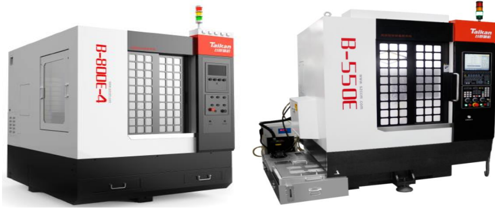
图3-4 精雕机系列产品示例