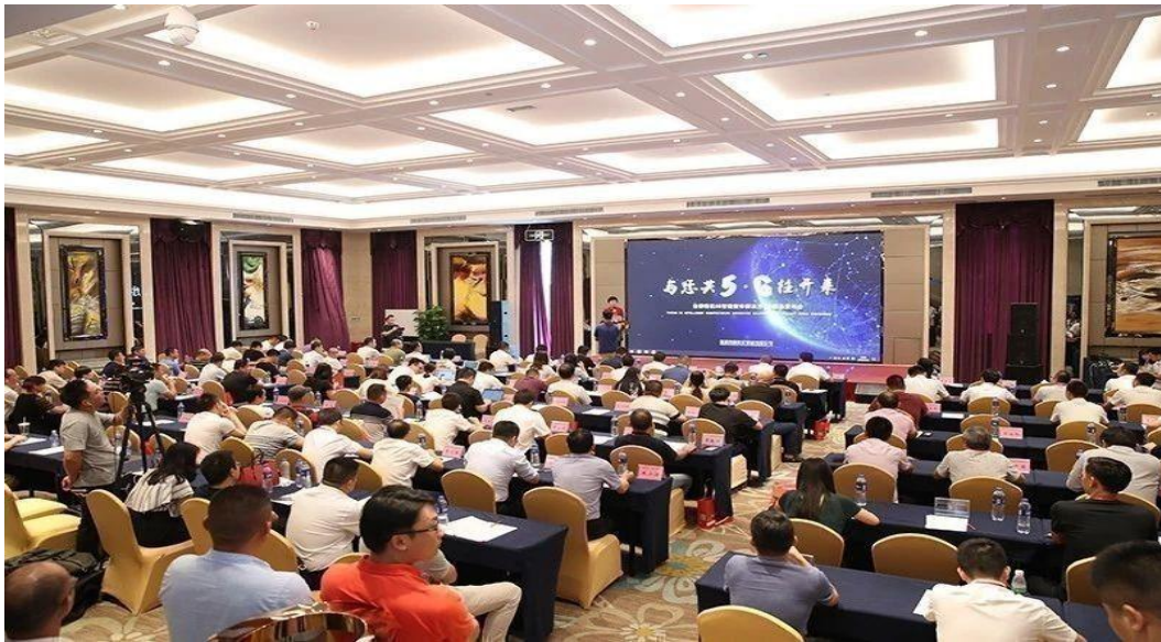
图4-1 公司5G智造整体解决方案&新品发布会