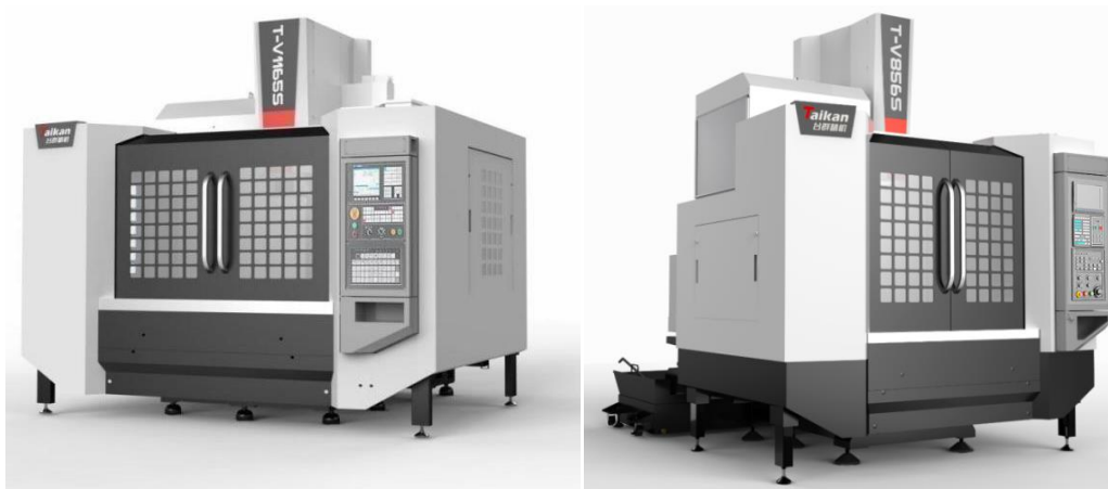
图3-3 立式加工中心系列产品示例

典型客户：比亚迪、上汽集团、长城汽车、广汽集团、中国中车、江淮汽车、中航沈飞、中直股份、拓邦股份、春兴精工、武汉凡谷等。