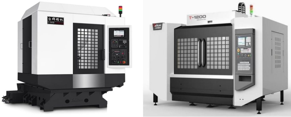
图3-2 高速钻铣攻牙系列产品示例