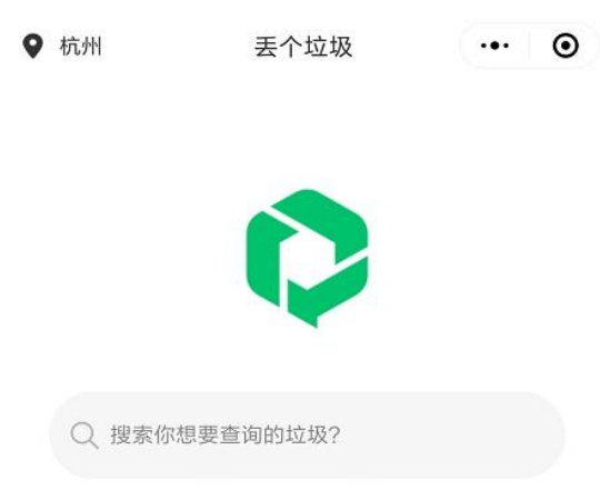
垃圾分类及“丢个垃圾”小程序