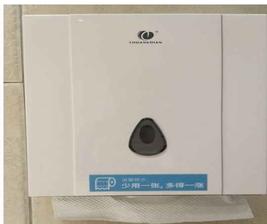
节约用水、用电、用纸宣传标识