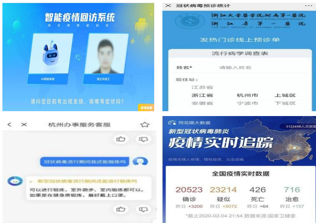
公司部分防控疫情产品

同时，公司面向湖北籍劳动者举办湖北专场线上招聘会，利用线上招聘系统，实现云宣传、云面试，全程无接触式的招聘，增加招聘岗位，优先考虑湖北籍候选人，助力疫情地区劳动者就业。