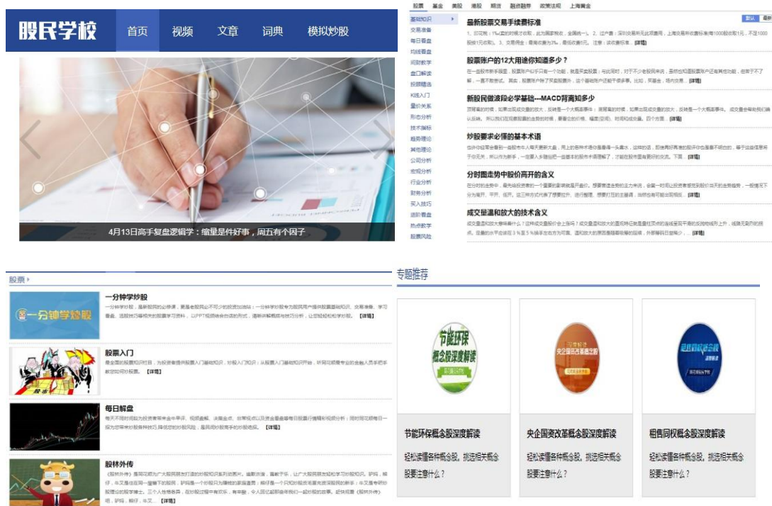
股民学校部分栏目

2019年公司继续升级“股民学校”（访问地址： http://t.10jqka.com.cn/school/home/index/ ），平台涵盖了文章、词典、视频、问答、模拟炒股等多个栏目，同花顺为投资者提供了从“学习—练习—实战”全流程、多维度的教育服务工作。一方面，公司成立了专门的金融研究院，与高校合作成立了金融技术工程研究院，招聘了一大批专业人才为投教基地制作原创性的文字研究、视频节目等。另一方面，基地设有专职的运营人员和内容编辑，集合了聚集在同花顺平台上的2,000余名资深股民充当投资者教育志愿者，为普通投资者答疑解惑。基地的内容编辑会对网络上的内容进行严格删选，删除涉及广告、具体证券投资建议等内容，仅保留对投资者了解基础知识和技术常识的中立客观的内容。