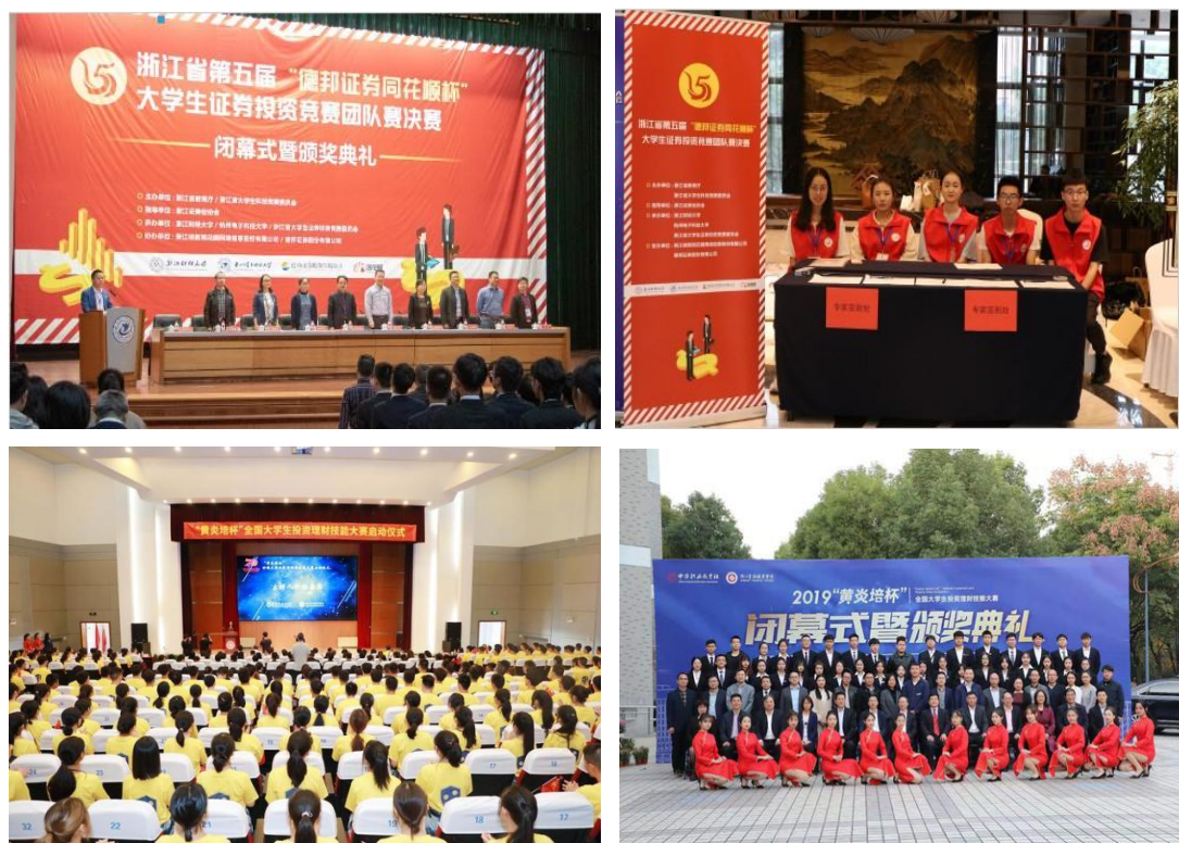
与高校开展形式多样的实训活动

通过各类在校大学生实训活动，为广大在校大学生提供了一个将理论运用到实践的平台，为金融专业建设和金融人才的培养起到了较好的推动作用。