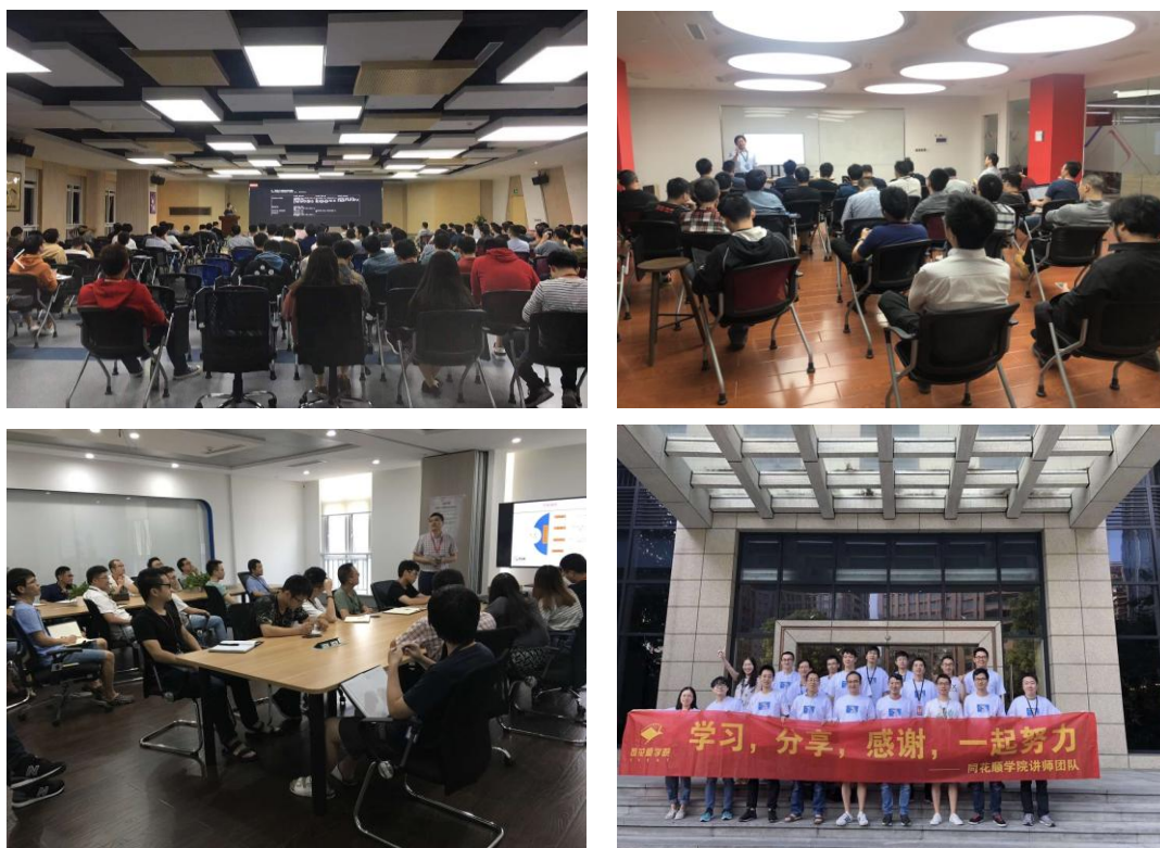
形式多样的员工培训

公司十分重视员工的内部培育工作，注重在公司内部培养和选拔人才，公司通过内部学习平台，依托技术俱乐部等学习型组织，发布并组织了丰富多样的培训学习活动。主要包括：员工素质拓展课堂、不同岗位的专业知识分享、职级晋升学习培训、业务&技术公开课。使员工的个人能力得到提升的同时，也增强了公司的核心竞争力，达到了双赢的目的。