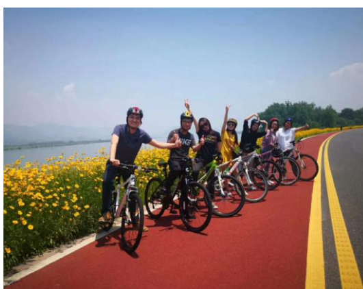
丰富多彩的员工团建活动

公司还特别注重员工的文化生活，员工在工作之余也能参加丰富多彩的文化活动。公司有公共阅览室，提供各类图书供员工取阅，定期会更新各类书籍和杂志；每年年会由员工组织表演各类文艺活动，全体员工欢聚一堂，提高员工的归属感和凝聚力。