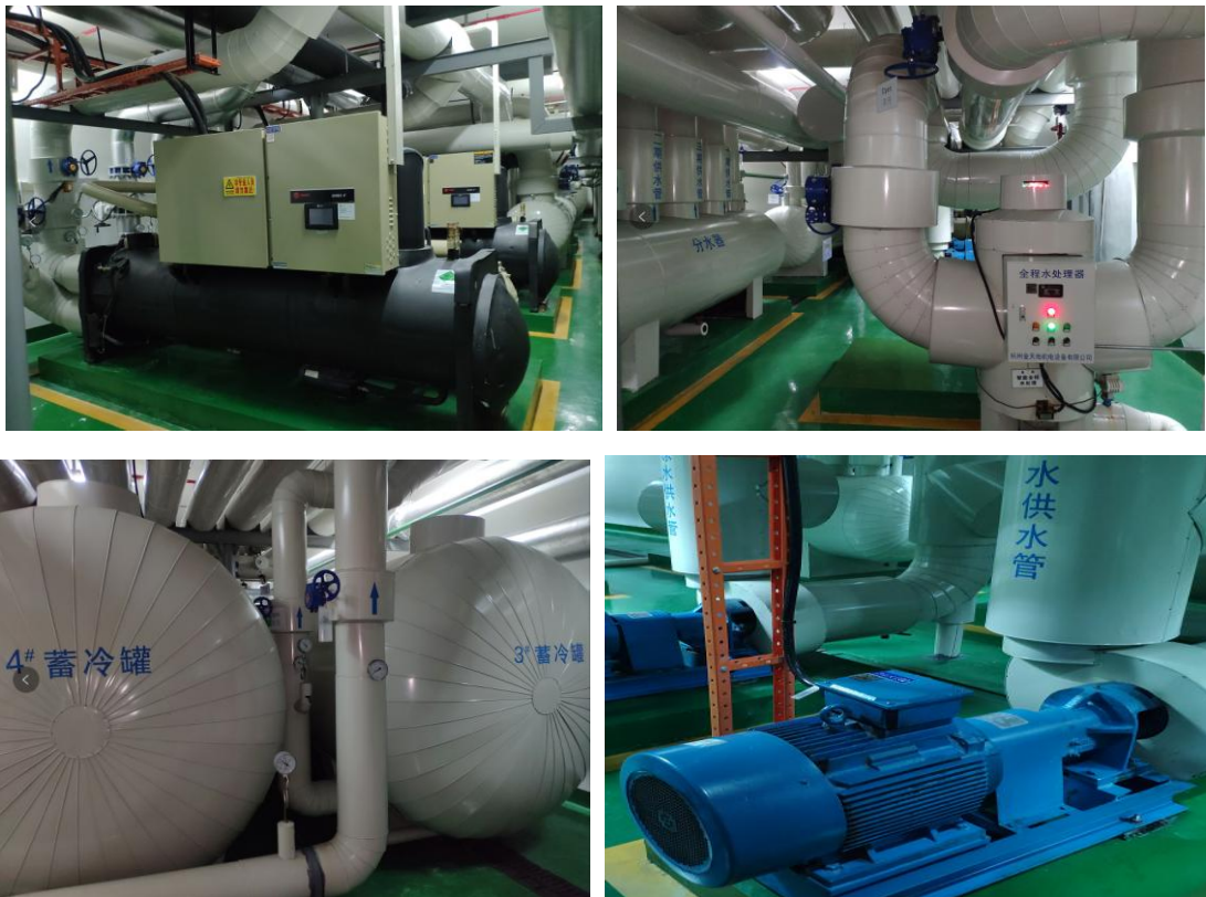
机房高效节能系统

公司的电器设备均符合国家节能环保要求，园区及办公场所的全部灯光采用LED节能灯光；公司内所有洁器都采用高效能品牌节水用器，减少水资源浪费；办公楼内空调采用VRV系统，监控中心统一设定和集中控制空调开放权限；机房制冷系统使用了水系统混合智能模式控制、水流量平衡智能控制、末端精密空调智能群控、蓄冷罐智能模式控制、通道封闭等一系列节能技术措施，节电率达25%，可减少230吨CO 2 排放量。有效控制用电量和碳排放量，为建设资源节约型社会贡献力量。