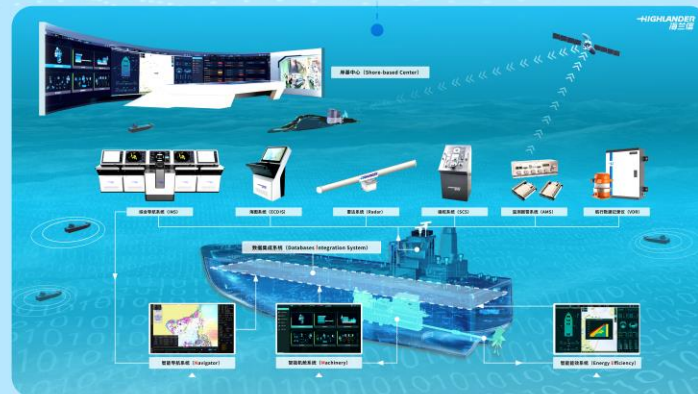
智能船舶和智能航运系统