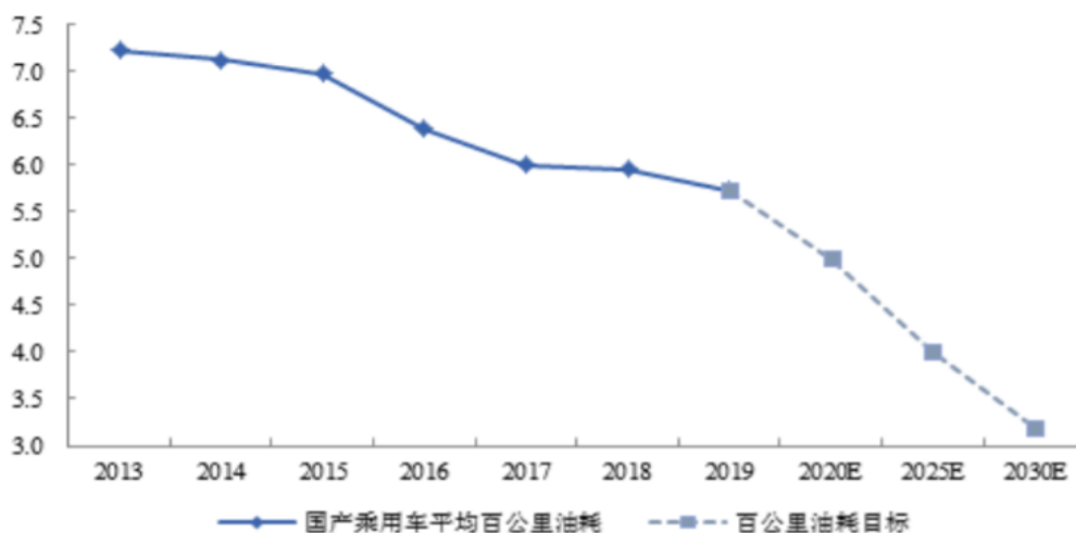
中国乘用车百公里油耗水平及油耗目标(升/百公里)

随着全球汽车保有量的增加，巨大的能源消耗和尾气排放对国家的能源安全和环境保护带来了越来越大的压力。因此，主要国家相继出台油耗法规，推动全球碳排放的降低。