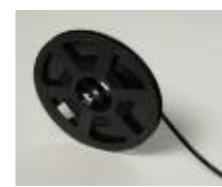
黑色防静电 PS 载带