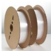
透明 PC 载带

黑色防静电 PS 载带： 以 PS/ABS/PS 复合片材为原料，采用德国成型工艺。