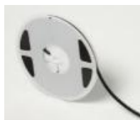
黑色防静电 PC 载带