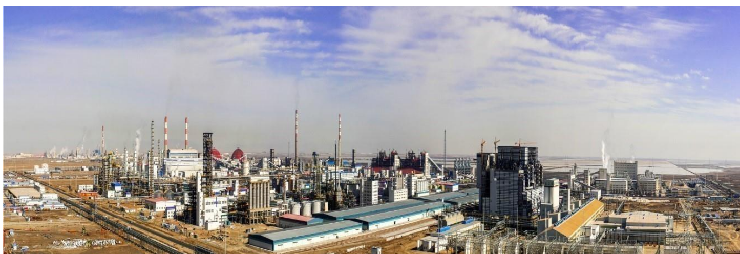
金属镁一体化项目全貌

报告期，镁业公司按照“开源节流、提质增效”的原则，聚焦“优化边际收益、单系列达标达产”，但由于设备故障、资金困难、资源配置、原材料采购价格上涨、环保投入等因素影响，导致生产未能按计划实施，部分装置处于低负荷运行状态，投入大产出小，产品成本偏高、边际效益未能完全释放，经济性较差，造成亏损17.8亿元。为了加速金属镁装置的达标达产工作，盐湖镁业已与国内化工行业优秀机构进行合作，对金属镁装置达标优化工作已全面展开，调整金属镁装置为单台、单线、单装置、单系统模式进行生产，确保在安全环保的前提下，精心组织装置开停车，减少开停车费用，提高装置驾驭能力，合理安排好各生产装置的物料平衡及生产负荷，对有边际效益的产品提产保质、追产增效方面优化生产经营方案，使全年亏损能降低。