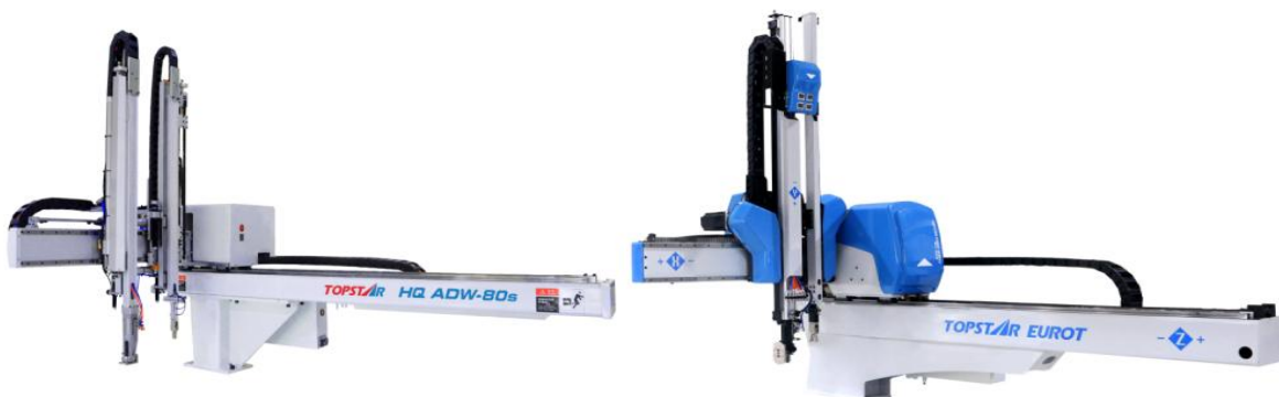
图2：XYZ三向伺服控制五轴机械手

报告期新品：公司于报告期内开发，并于 2019 年 5 月推向市场的 HQ 系列直角坐标机器人。顺应设备投资需求趋弱的市场变化，推出惠企专机 HQ 系列，提升设备标准化，大幅缩减物料类别、设备型号和定制化维度等，通过规模销售、技术支撑和供应链整合，产品价格透明化并同步降低了生成成本，保障自身产品竞争力和利润率的同时，一定程度缓解了下游客户的资本支出压力并提升了行业集中度，开启市场竞争格局的重塑。