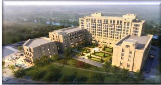
(闵瑞路养老项目效果图)