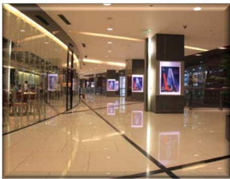
（地砖-上海环球金融中心）