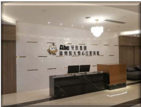
（徐州医大悦心口腔医院）