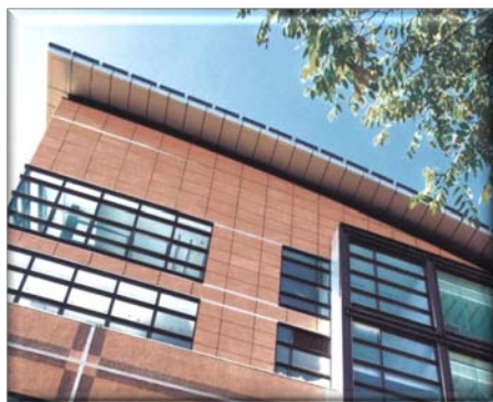
（外墙—北京北广传媒）