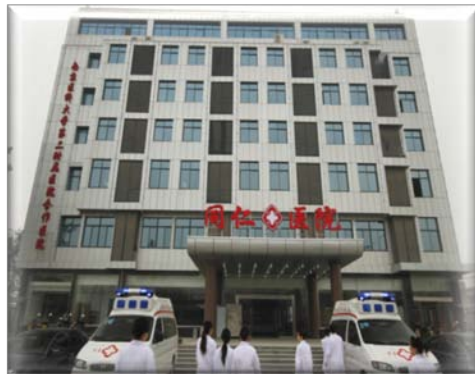
（全椒同仁医院有限公司）