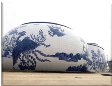
（外墙定制—南昌万达文化旅游城）