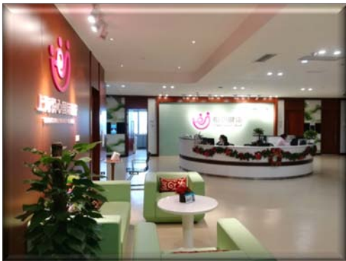
（上海悦心综合门诊部）

公司已陆续投资的医疗机构及合作项目包括全椒同仁医院有限公司、上海悦心综合门诊部、广州悦心普通专科门诊部、徐医悦心中医门诊部、美国日星生殖中心、徐州医大悦心口腔医院、宜春妇产生殖合作项目等。