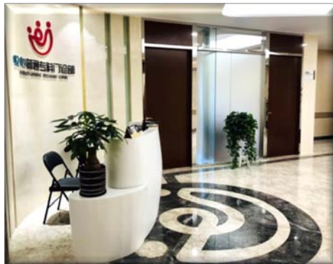
（广州悦心普通专科门诊部）