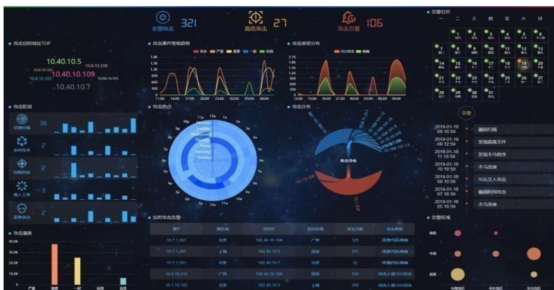
图2 态势感知云平台

公司安全产品中心搭建安全云平台，以数据中心IDC或云业务数据和客户互联网应用为基础的监测、检测、扫描、探测、防护、安全运维管理、安全服务为主的平台产品，主要包括安全云、态势感知、大数据分析等。