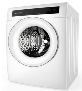
图 6：格力净柔洗衣机

为维护消费者权益，国家颁布关于洗衣机测试认证的新政策——GB//T4288-2018《家用和类似用途电动洗衣机》（以下简称“新国标”），净柔洗衣机是首批通过国家新国标测试认证的洗衣机。此外，针对洗衣噪音大的痛点，净柔洗衣机在减少噪音方面进行深入研究并不断改善，使用框架静音法与动平衡系统设计，获得国家静音认证。