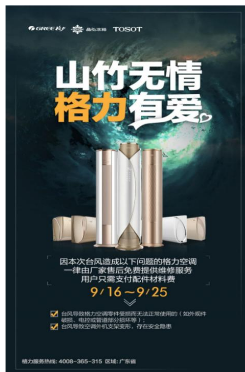
图 10：格力对台风损坏空调免费维修活动

为了让广大消费者享受并体验格力的优质服务，格力电器在 2018 年旺季期间开展安装维修服务评比活动，通过评比，推进维修服务 24 小时完工的管理。