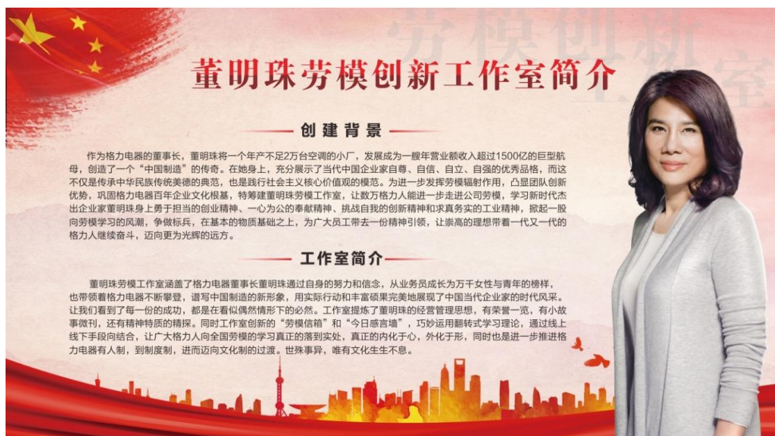
图 13：董明珠劳模创新工作室