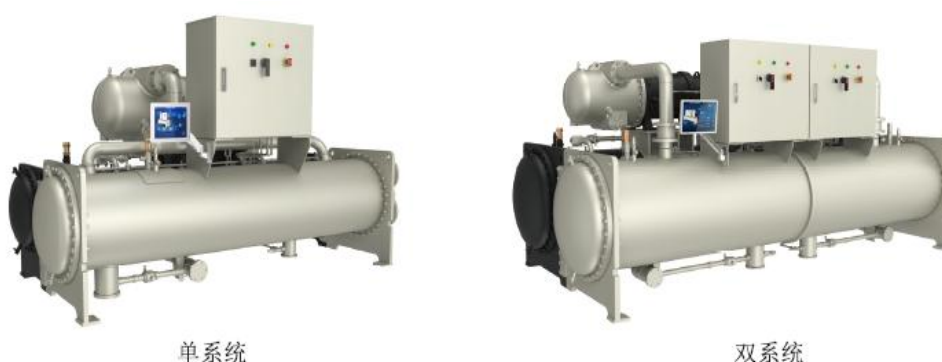
图 3：格力永磁同步变频螺杆式冷水机组

GMV6 多联机是格力自主研发的全球首款人工智能多联式空调机组，结合大数据云平台、人工智能控制技术以及国际领先的 CAN+ 通讯技术，通过研究天气预测联动控制、故障预测诊断、自适应调节控制、用户需求分析等技术，实现超低功耗 1W 待机，解决多联机待机功耗高、实际运行效率低、舒适性差等技术难题。同时可实现 -30^{\circ}\text{C} \sim 55^{\circ}\text{C} 宽广的运行范围，是行业内运行工况跨度最大的多联机产品。