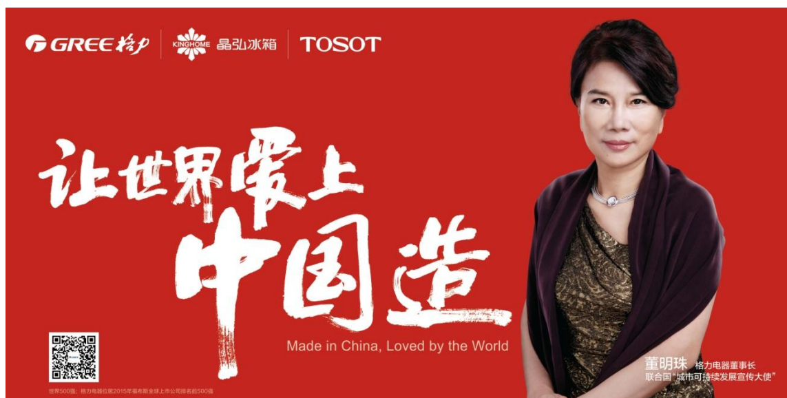
图 1：让世界爱上格力造

备、模具等领域，已经从专业空调生产延伸至多元化的高端技术产业。2018年，公司营业总收入突破 2000 亿元，净利润超过 260 亿元，纳税 160.23 亿元，连续 12 年位居家电行业纳税第一。