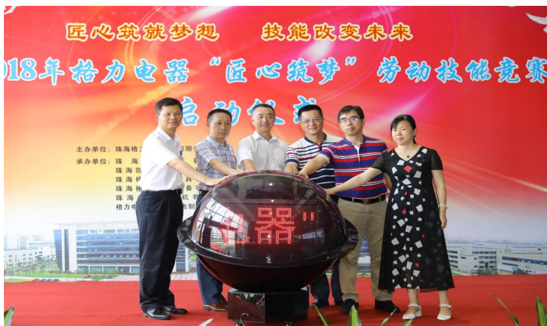
图 12：“匠心筑梦”劳动技能竞赛启动仪式

开展各层级职业技能精英赛。2018年组织完成广东省职业技能大赛可编程控制竞赛、珠海市级职业技能竞赛“格力杯”数控铣工技能大赛、叉车技能竞赛和办公软件劳动技能竞赛、公司劳动技能竞赛活动，本年度技能大赛共开展公司级赛事18项、单位级赛事480余项。两级赛事项目涉及转型升级类、手工技能类等多个类别，涵盖大部分一线操作岗位；同时通过线上互动、线下动员，今年参与、关注两级赛事的选手及员工超过60000余人次。