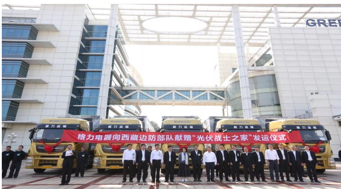
图 18：“光伏战士之家”发运仪式

为了诚挚致敬忠诚奉献、保家卫国的当代军人，格力电器 2018 年 11 月 23 日向西藏边防部队献赠了 10 套“光伏战士之家”，致力改善西藏边防高寒艰苦地区战士的工作和生活条件。