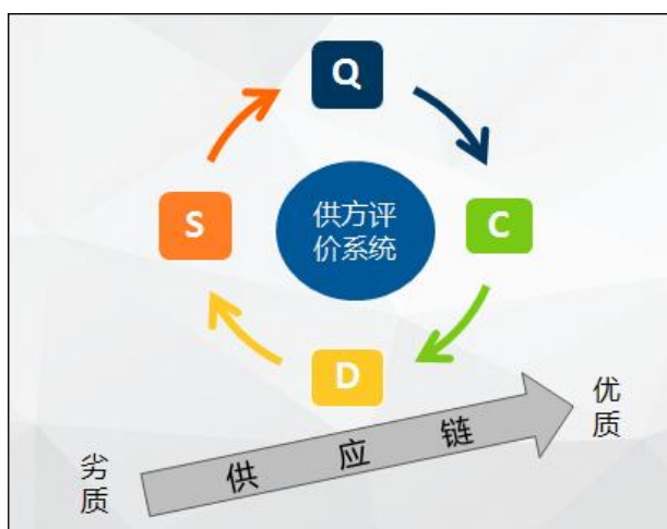
图 15: Q-C-D-S 供应链评价系统

格力电器联合制定了“3 优+1”的供应链管理创新模式；“3 优+1”是以“优量、优价、优供、支持格力”为评价核心，以及评价应用指南为方法，最终形成公开、透明、客观、系统、务实的供方管理模式；包含 Q-C-D-S 供应链评价系统和评价应用指南。在保证质量第一前提下，有机整合质量、价格、供应、支持格力的多维度评价，驱使整改供应链的结构优化，实现物料质量的持续提升、价格的稳定下降，共赢合作，保障公司利益最大化。