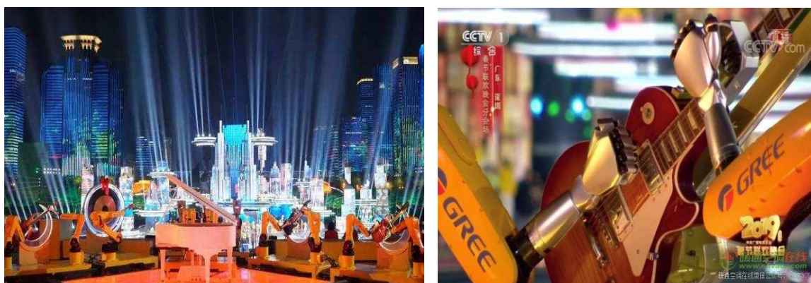
图 8：格力机器人乐队荣登春晚现场

格力机器人加工精度高、一致性好、运行流畅、响应速度快，并可完成高精度高难度的歌曲演奏。在 2019 年央视春晚中，格力机器人乐队成功登上 2019 央视春晚舞台，与 200 名专业钢琴师同台献艺，搭档朗朗、周华健、任贤齐演奏金曲《朋友》，为亿万观众献上了一场别开生面的表演，将工业机器人高效灵活的特点表现得淋漓尽致，同时彰显了格力自主创新中国造的不凡实力。