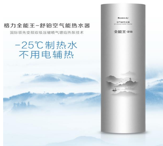
图 4：格力全能王-舒铂空气能热水器

火凤凰强热型暖冷一体机连续三年参与北方煤改电项目，中标北京、天津 9 个区县煤改电项目，并连续三年获评“北京市煤改清洁能源空气源热泵行业突出贡献奖”。