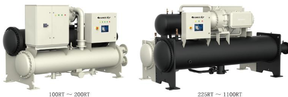
图 2：格力磁悬浮变频离心式冷水机组