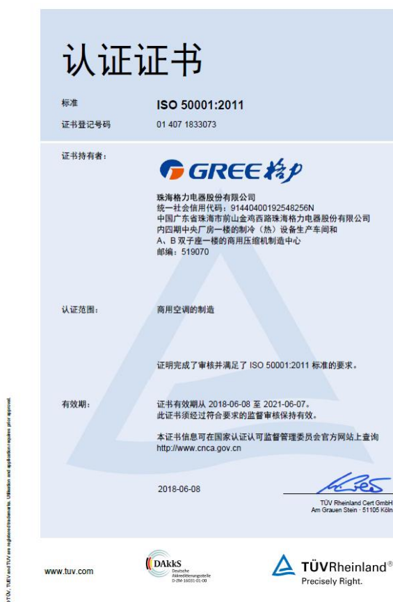
图 17: 能源管理体系认证证书