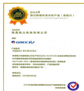
图 7：格力净柔洗衣机《通过新国标洗衣机产品（首批次）》认证证书