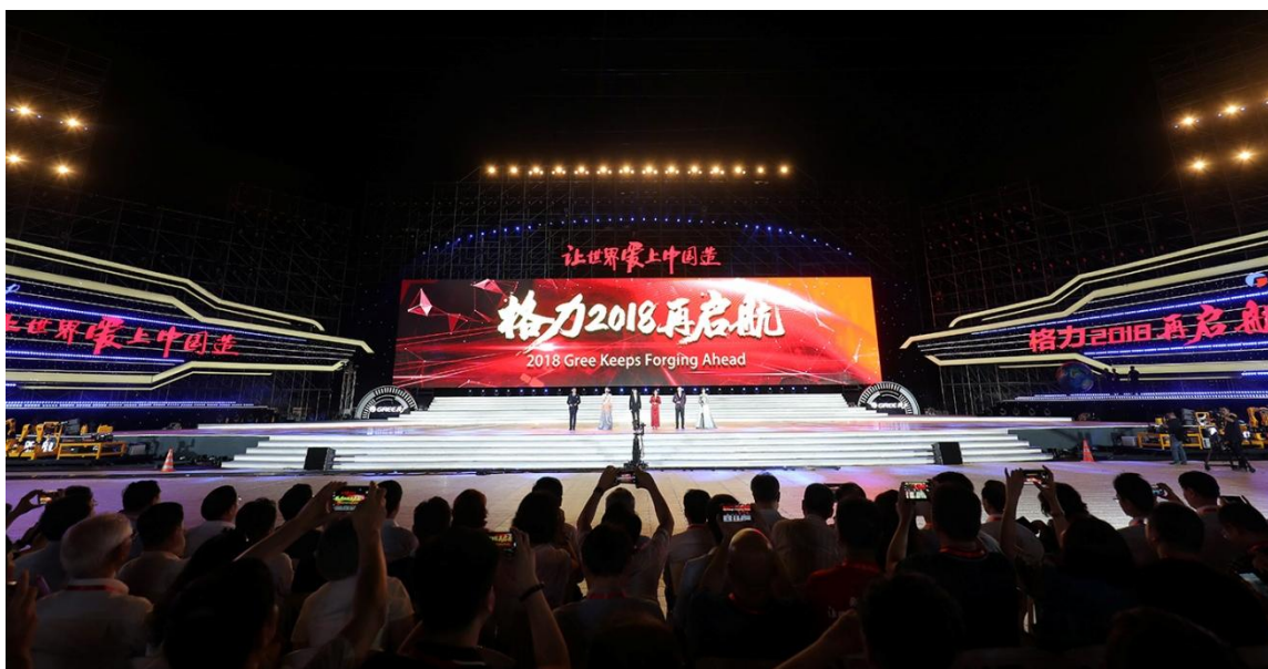
图 14：2018 年 5 月 16 日“格力 2018 再启航”梦想盛典大型晚会

公司组织策划 2018 格力电器“舞动元宵，点亮新春”游园会，现场参与互动人数高达千人，充分利用新媒体技术实现现场直播盛况。2018 年正值改革开放四十周年之际，为响应党和国家“紧紧围绕将改革开放进行到底”主题，组织“让世界爱上中国造”2018 届大学生合唱比赛，开展形式多样的群众性主题宣传活动，讲好改革开放的故事。