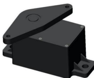
手动式电子油门踏板总成 (应用于中国重汽豪沃)