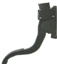
悬挂式电子油门踏板总成 (应用于乘用车：通用新赛欧)