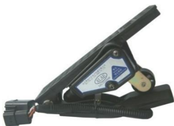
踏板式电子油门踏板总成 (应用于商用车：一汽解放J5M)