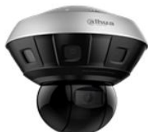
守望者全景红外网络摄像机

公司进一步完善视频监控产品的多维感知能力。如“巨无霸”护罩一体式摄像机产品，可获取人脸检测、车牌识别、机动车、非机动车、行人检测/抓拍、手机MAC信息采集、GPS/北斗定位、RFID数据采集等感知信息。如热成像摄像机系列产品，可获取火情信息、物体温度信息等多维数据，基于公司热成像产品的“大华蓝天卫士秸秆焚烧监控综合解决方案”荣获A&S2018年度TOP10系统解决方案。