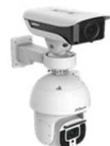
智慧交通枪球联动网络摄像机