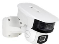
双4K四目灵瞳网络摄像机