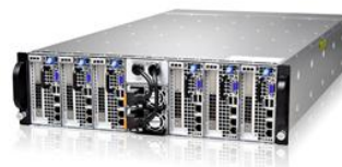
“睿智”智能视频结构化服务器