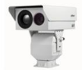
智能热成像摄像机