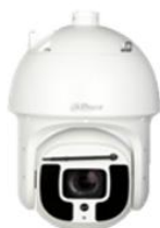
4M极光球形网络摄像机