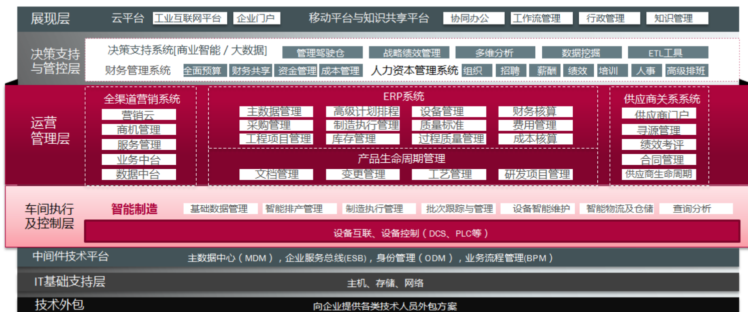
赛意信息360°信息化服务全景图

在十多年的快速发展过程中，公司积累了丰富的解决方案及众多的行业客户案例，成功为超过500家来自于制造、零售、服务等行业的企业级客户提供了丰富而具有竞争力的数字化转型服务，拥有华为技术、美的集团、大疆创新、视源股份、奥克斯集团等众多优质客户。公司的咨询顾问团队在企业数字化转型过程中的规划咨询、方案设计、系统实施、应用集成及设备互联等领域具有丰富的实施经验，技术研究团队