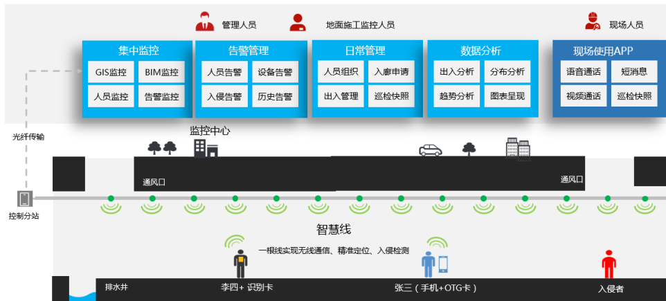
(综合管廊解决方案展示图)