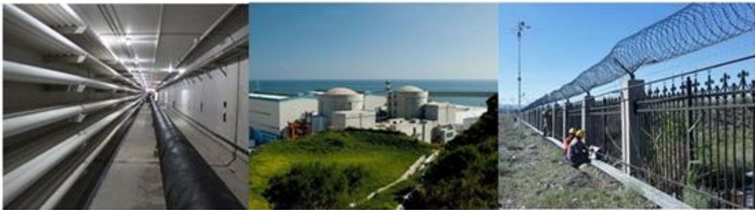
(管廊、核岛、周界安防场景图)

公司致力于实现工业领域完全自主可控的物联网与统一通信平台的建立，推动智能革命。公司完全独立自主开发的物联网通信技术与产品具备强大的网络监控、信息安全、无线感知、精准定位和大数据接入能力，广泛应用于工业互联网、城市综合管廊和周界安防等领域并取得重大进展。