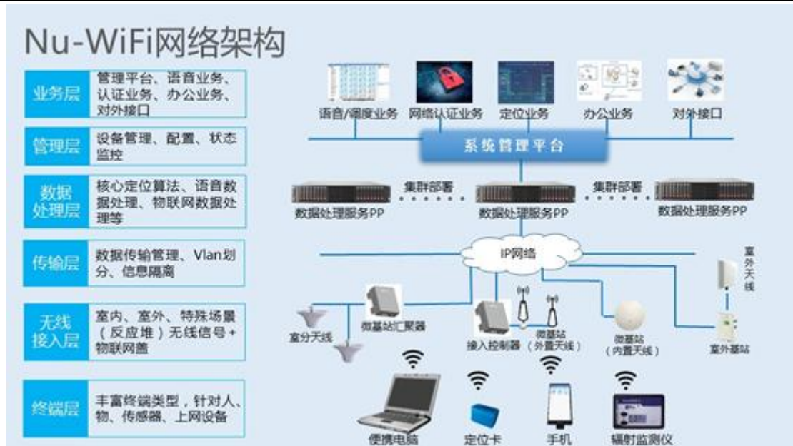
(Nu-WiFi核电专业无线通信系统架构图)