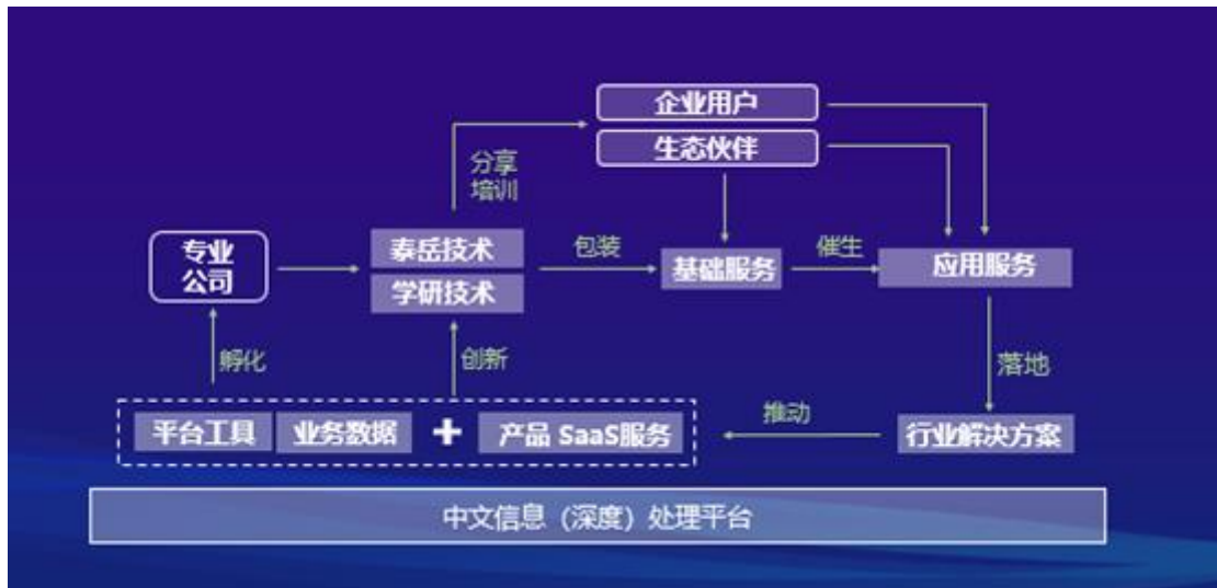
（中文信息（深度）处理平台生态运营模式）

中文信息（深度）处理开发创新平台，是公司联合中国中文信息学会、中国声谷，共同打造的人工智能语义产业平台 ( http://www.china-nlp.com )，可提供自然语言理解、人机交互、机器翻译、知识图谱等领域120多类人工智能服务，并提供集语义资源、算法体系、场景化能力于一体的NLP集成开发环境，围绕认知智能打造开发工具、将技术PaaS化、SaaS化，意在构建产学研用育的完整闭环生态。