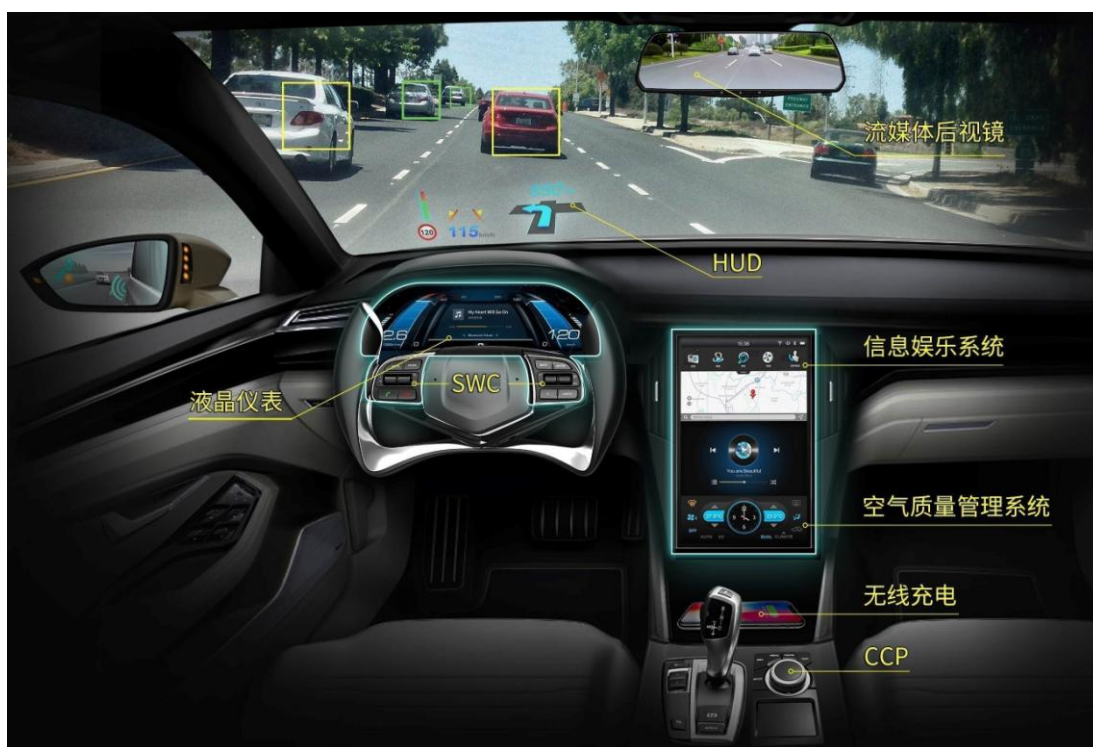
产品在驾驶舱内的应用场景示意图

1、汽车电子板块专注于车载影音、车载互联、车载导航、数字仪表、流媒体后视镜、360环视系统、抬头显示、空调控制器、车载空气净化器、车载摄像头、无线充电、胎压监测等较为丰富的汽车智能驾驶座舱电子产品线，并逐步将其系统集成，增强了配套能力。