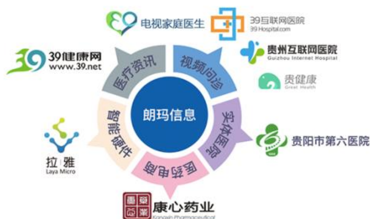
图：朗玛信息互联网医疗生态圈

公司参股的贵阳市医药电商服务有限公司 2016 年完成了对贵州康心药业有限公司的全资收购，资产规模以及盈利能力获得快速增长，医药电商公司通过集中采购和带量采购，降低药品采购成本和用户药品支出，并逐步扩大医疗机构覆盖范围，实现经济效益和社会效益兼得。在二者强强联合、优势互补下，2017 年业务规模大幅度增长，2017 年实现营收 303,097.28 万元（含税收入约计 352,830.55 万元），净利润 13,360.19 万元，排名贵州医药流通企业第一，入选全国医药批发企业百强。