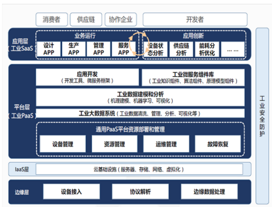
工业互联网平台功能框架图

公司经过多年发展，拥有大量的工业客户群，具备非常难得的工业互联网平台应用场景，2018 年公司将以市场需求为驱动，在电气产品、节能服务、用电服务各项业务拓展的同时，逐步积累综合能源数据资产，积极运用工业互联网思维，为公司业务经营管理进行提升和赋能，并以期引发以综合能源大数据分析为主要特点的新业态、新商业模式。