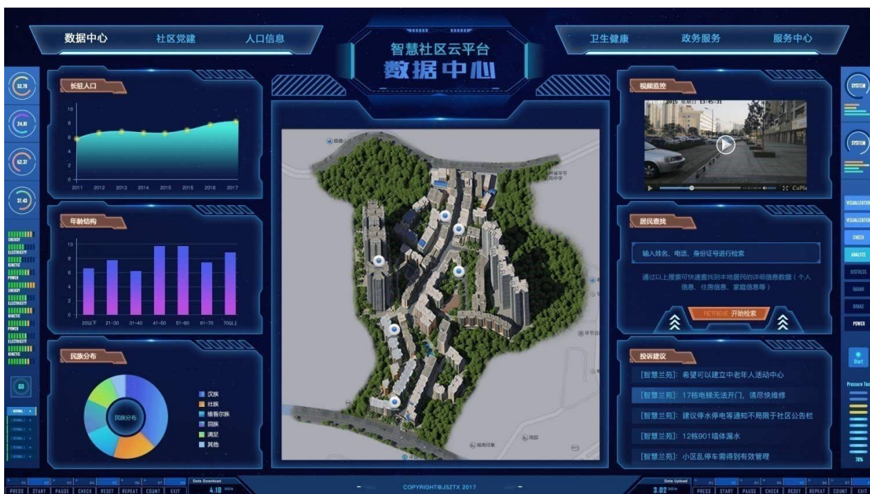
(上图为路通视信智慧社区云平台)