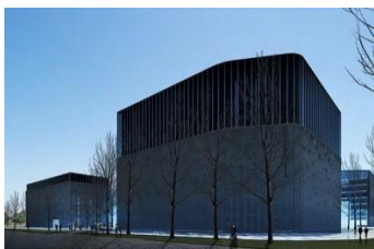
国富光启上海月浦、北京航丰数据中心

公司为了加强大数据、互联网+、图像分析处理等相关领域的科学研究，与知名企业深入合作，如与腾讯云签署合作协议，共同建设腾讯赛为大数据实验室，促进产学研的深度融合和发展，推动大数据产业技术进步。