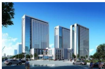
贵州安顺数据中心