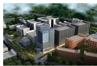
深圳横岗雅力嘉工业园数据中心