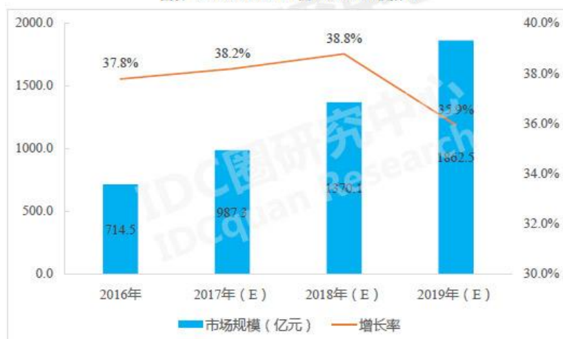
图表 75：2017-2019 年中国 IDC 市场规模预测