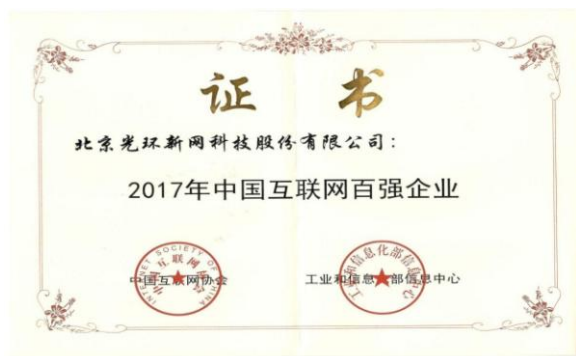
2017年中国互联网百强企业-光环新网

报告期内，中金云网成为首批面向金融行业的国家级绿色数据中心，荣获“2016-2017年度优秀数据中心奖”、“2016-2017年度中国优秀外包数据中心奖”、“2016-2017年度中国金融科技创新榜优秀品牌”等诸多奖项；无双科技在过去的一年，实现了各项业务指标的大幅增长，并再次被认证为百度五星合作伙伴，获得多个行业案例大奖，成为国内互联网营销云计算SaaS解决方案服务的领航者。报告期内，公司荣获中国互联网协会及工业和信息化部信息中心颁发的“2017年中国互联网百强企业”证书、荣膺由证券时报、中国基金报、杭州市人民政府、中国上市公司发展联盟等联合评选的“中国创业板最具成长性上市公司十强”等殊荣。