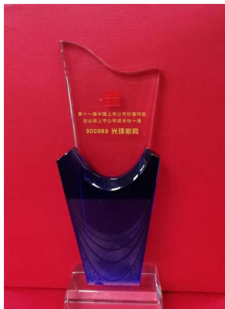
中国创业板最具成长性上市公司十强-光环新网