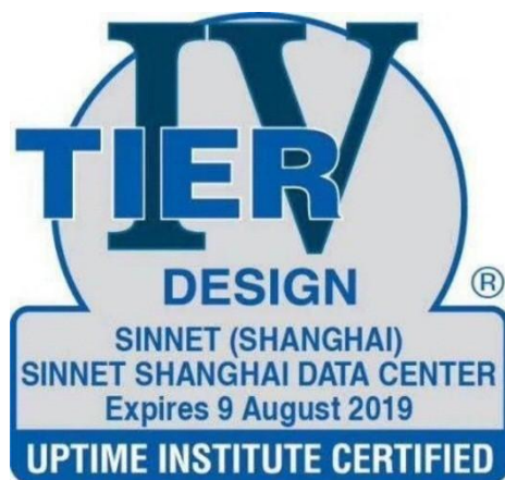
T4认证-光环新网上海数据中心

报告期内，公司在加快项目建设的同时进一步提高项目建设质量，IDC服务能力得到进一步提升。其中，公司上海嘉定数据中心经过全球数据中心业界最知名、权威的认证机构Uptime Institute为期数月的严格评审，获得Uptime Institute T4标准认证，成为上海地区唯一一家获得T4标准认证的商用数据中心，将为广大商企用户提供国内最高品质的云计算一体化解决方案服务。