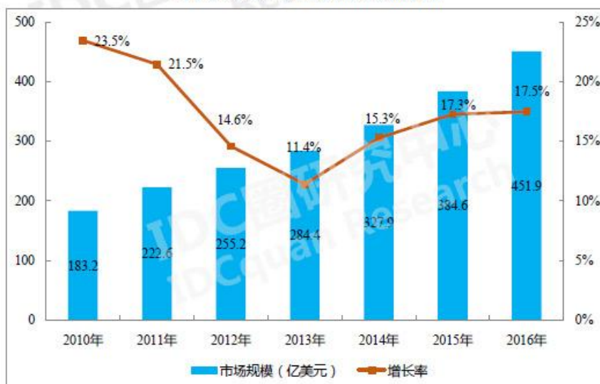
图表 1：2010-2016 年全球 IDC 市场规模分析