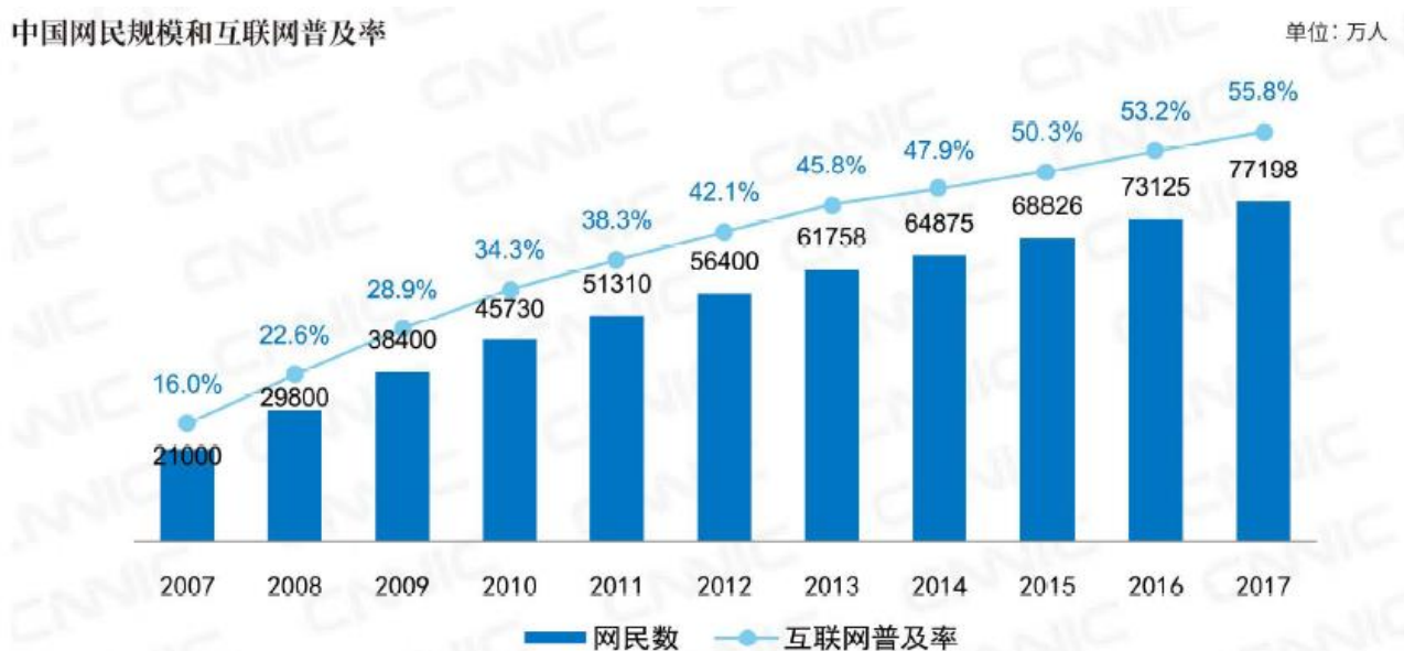
中国网民规模和互联网普及率

互联信息中心（CNNIC）发布的《第41次中国互联网络发展状况统计报告》显示，截至2017年12月底，我国网民规模达7.72亿，较2016年底新增网民4074万人，互联网普及率55.8%；手机网民规模达7.53亿，较2016年底新增手机网民5734万人，网民中使用手机上网的人群占比达到97.5%。如图所示：