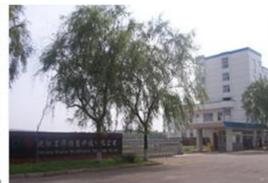
图 4: 沈阳名华模塑科技有限公司