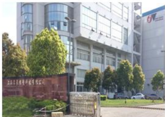
图 1: 上海名辰模塑科技有限公司