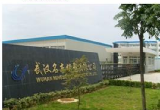
图 3: 武汉名杰模塑有限公司