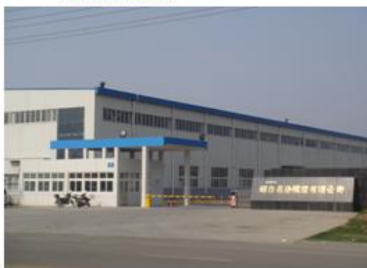
图 2: 烟台名岳模塑有限公司