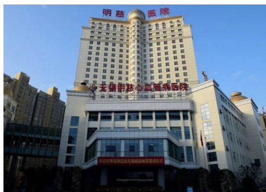
图 7: 无锡明慈心血管病医院有限公司