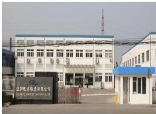
图 5: 江阴德吉铸造有限公司