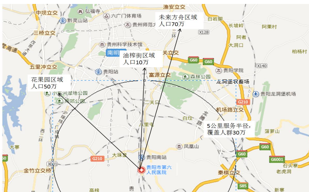
图 2 贵阳第六人民医院覆盖范围

伴随大型社区的发展，贵阳第六人民医院覆盖范围内人口增长迅猛，经济发展潜力巨大。贵阳第六人民医院目前是半径 8 公里内的唯一一家市级综合性二级甲等医院，可服务人群将近 160 万。医疗服务需求与当地发展相对缓慢的医疗资源形成明显反差，为作为区域医疗龙头的第六人民医院的发展带来前景良好的发展空间。